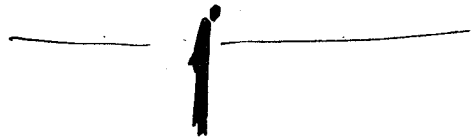
Vámos István rajzai