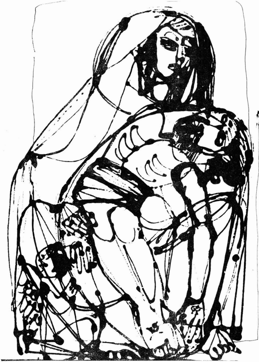
Szántó Piroska: Helikoni Pieta