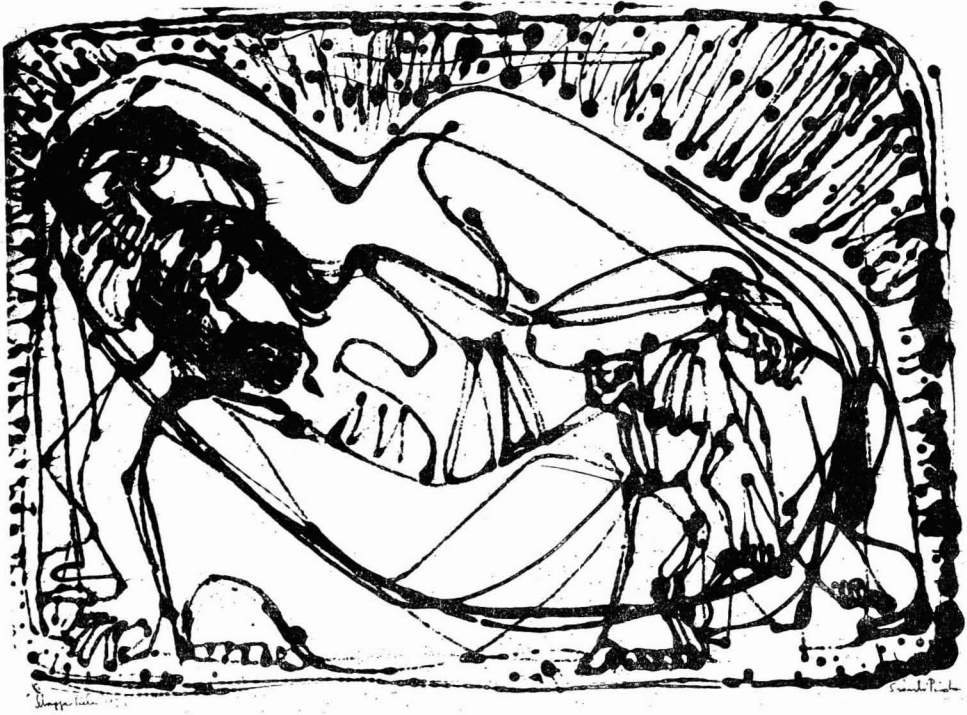
Szántó Piroska: Szürke Pieta