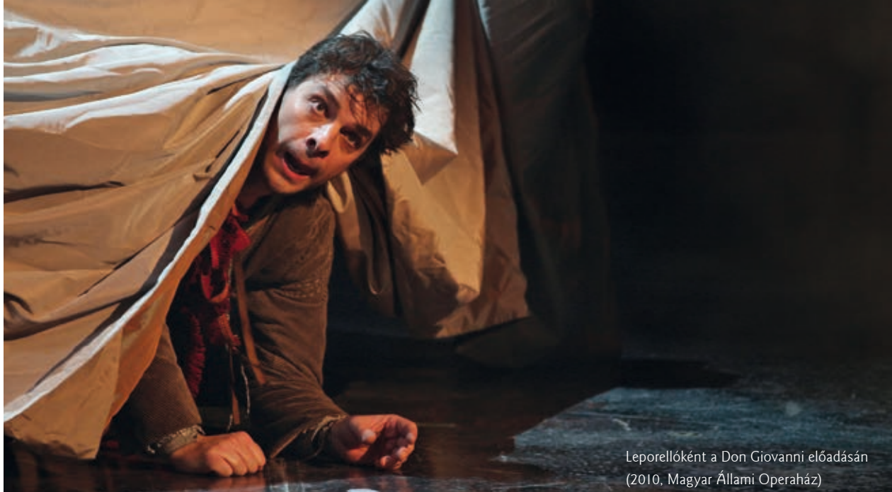
Leporellóként a Don Giovanni előadásán (2010, Magyar Állami Operaház)