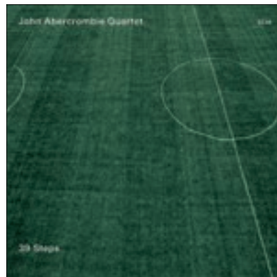
JOHN ABERCROMBIE QUARTET: 39 STEPS ●●●●○