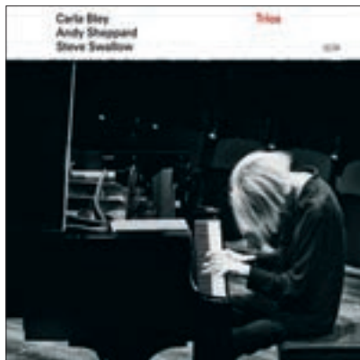
CARLA BLEY/ANDY SHEPPARD/ STEVE SWALLOW: TRIOS ●●●●○