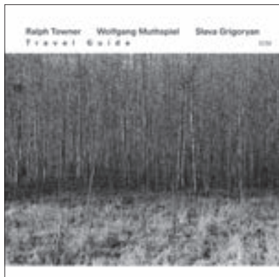
RALPH TOWNER, WOLFGANG MUTHSPIEL, SLAVA GRIGORYAN: TRAVEL GUIDE ●●●●○