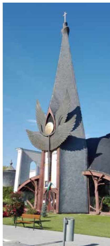
▲ Katolikus templom, Százhalombatta