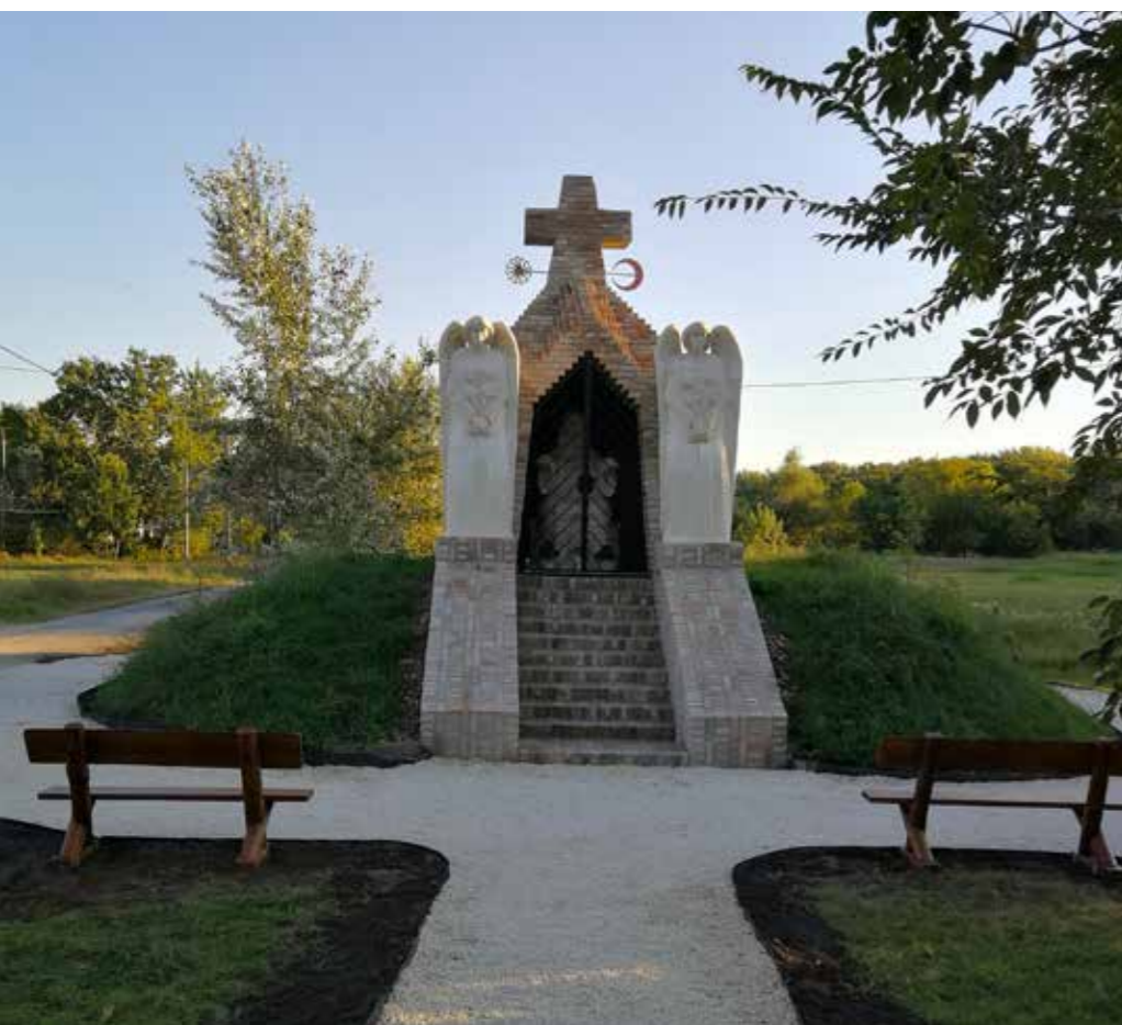
▲ Boldogasszony Házacska, Mártély

The chapel in Mártély was designed by Imre Makovecz more than ten years ago. The House of the Blessed Virgin is barely larger than the baroque sculpture house wedged into the fabric of the city, on the banks of a stream. In fact, its monolithic nature makes it even simpler than that. It is a hallowed place where man will find solace.