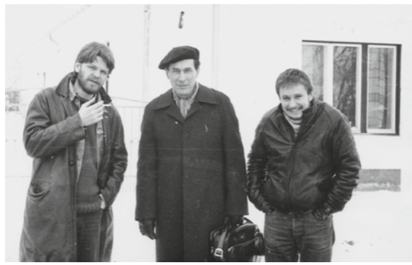
▲ 1990 körül