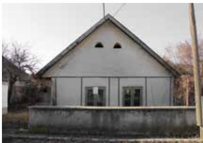
◀ Utcai homlokzat az átépítés előtt