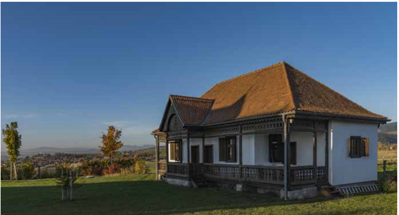
▲ Népi ház költöztetés, felújítás, Csíkcsootfalva, tervezés éve: 2017. Építész munkatárs: Radev Gergő, András Szilárd

Egy egységes és hagyományos faluképre, utcaképre egyébként a legveszélyesebb dolog az idegen formák, anyagok, színek, arányok térhódítása, mindez oly módon, hogy a rend és harmónia helyett egyfajta diszharmónia vagy káosz termelődik. En-