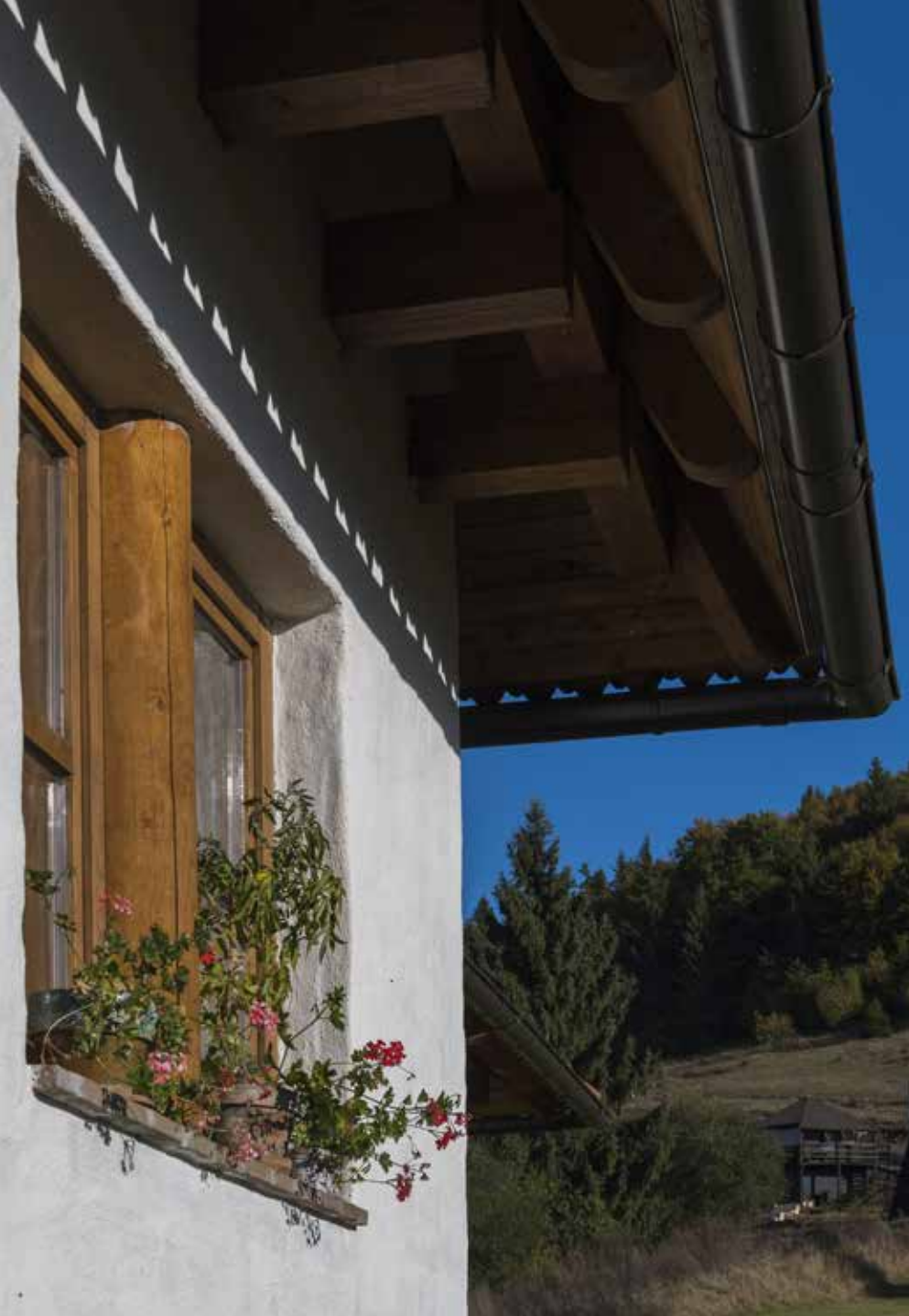
◀ Családi ház, Csíksomlyó, tervezés éve: 2013. Építész munkatárs: Nonn Zsuzsa

léletemben. Ez a minőségi és mélységi kapcsolat, kommunikáció a különböző részegységek között, ami engem érdekel. Hogy a dolgok nemcsak úgy egymás mellett vannak, hanem egymással úgy vannak kapcsolatban, mondhatom azt is: úgy tudnak egymással szabadon kommunikálni, hogy közben megtartják különbözőségüket. Maga a kommunikáció, a kapcsolódás az, ami egységbe formálja őket. Ha nyitott vagyok a természetre, a teremtett világra, ezt az egységet tapasztalhatom meg minden élő organizmusban. A természetben minden mindennel így kommunikál és kapcsolódik, ez köti össze a látszólag összeférhetetlen dolgokat is. Mert ha felszínesen vizsgálok valamit, bármit a valóságból, csak akkor van összeférhetetlenség – ha ugyanezt a mélységből vizsgálom, egységet tapasztalhatok. Ezért fontos törekednem az igazi tudásra, megértésre és látásra, ami a dolgokhoz való nyitottságomat, bizalmamat és szolgálatomat feltételezi.