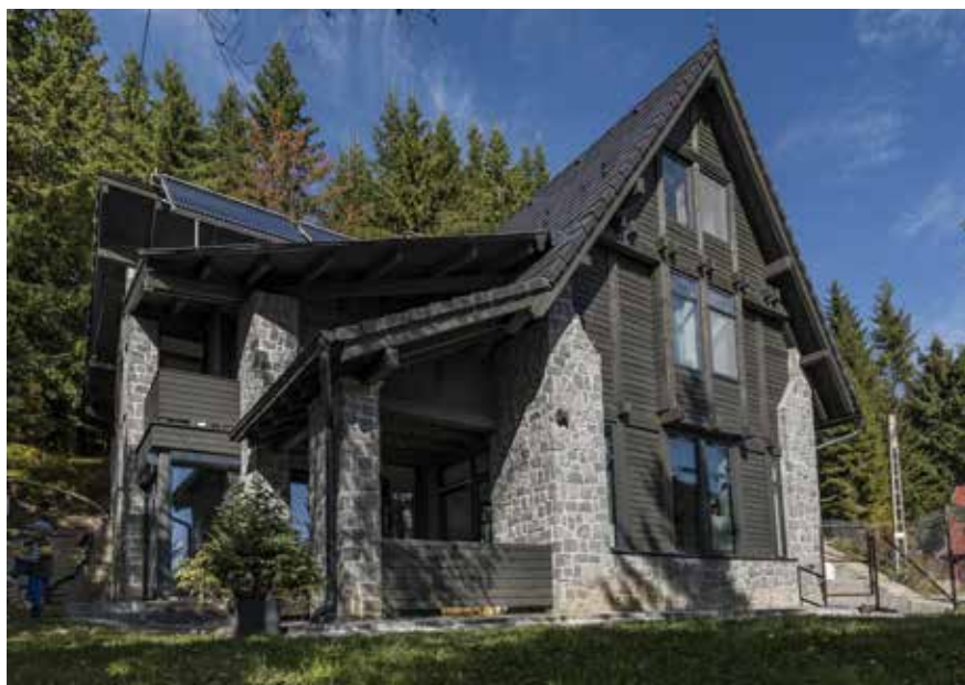
▲ Családi ház, Hargitafürdő, tervezés éve: 2011. Építész munkatárs: Nemes Dávid

Egy egyetemközi diákkapcsolat révén páran meghívást kaptunk a kolozsvári egyetemről a visegrádi építész-táborba.