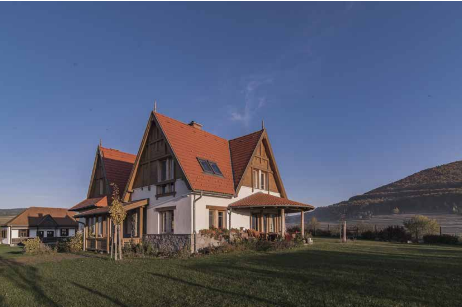
▲ ▼ Csobotfalvi családi ház