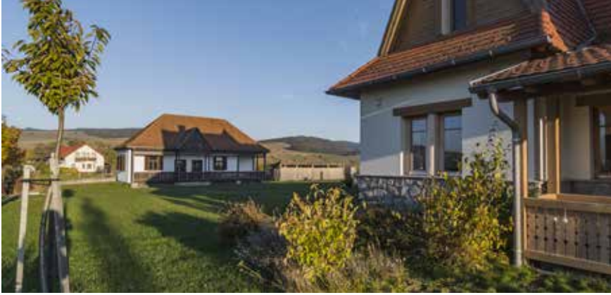
◀ Népi ház költöztetés, felújítás és családi ház tervezés, Csíkcsootfalva

Székelyföldön a közérdekű építkezések jó része magyar állami támogatásokból épül, mint például az általunk tervezett gyergyószentmiklósi óvodabővítés, amelyet a határon túli óvodákat támogató program finanszíroz.