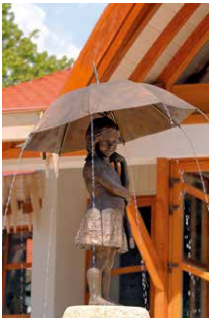
▲ Esernyős kislány. Györfi Lajos szobra