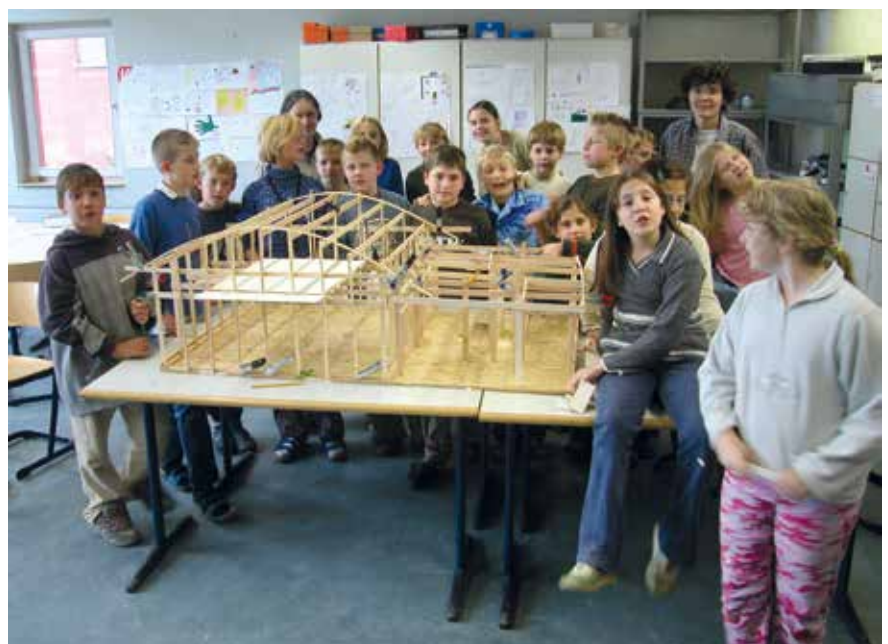
▲ Workshop, Evangélikus Általános Iskola, Gelsenkirchen–Bismarck, Németország. Építész: Peter Hübner, 1997