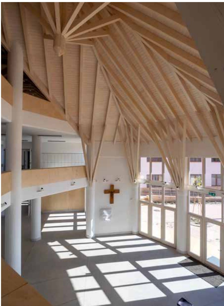
◀ Katolikus Gimázium, Veresegyház.