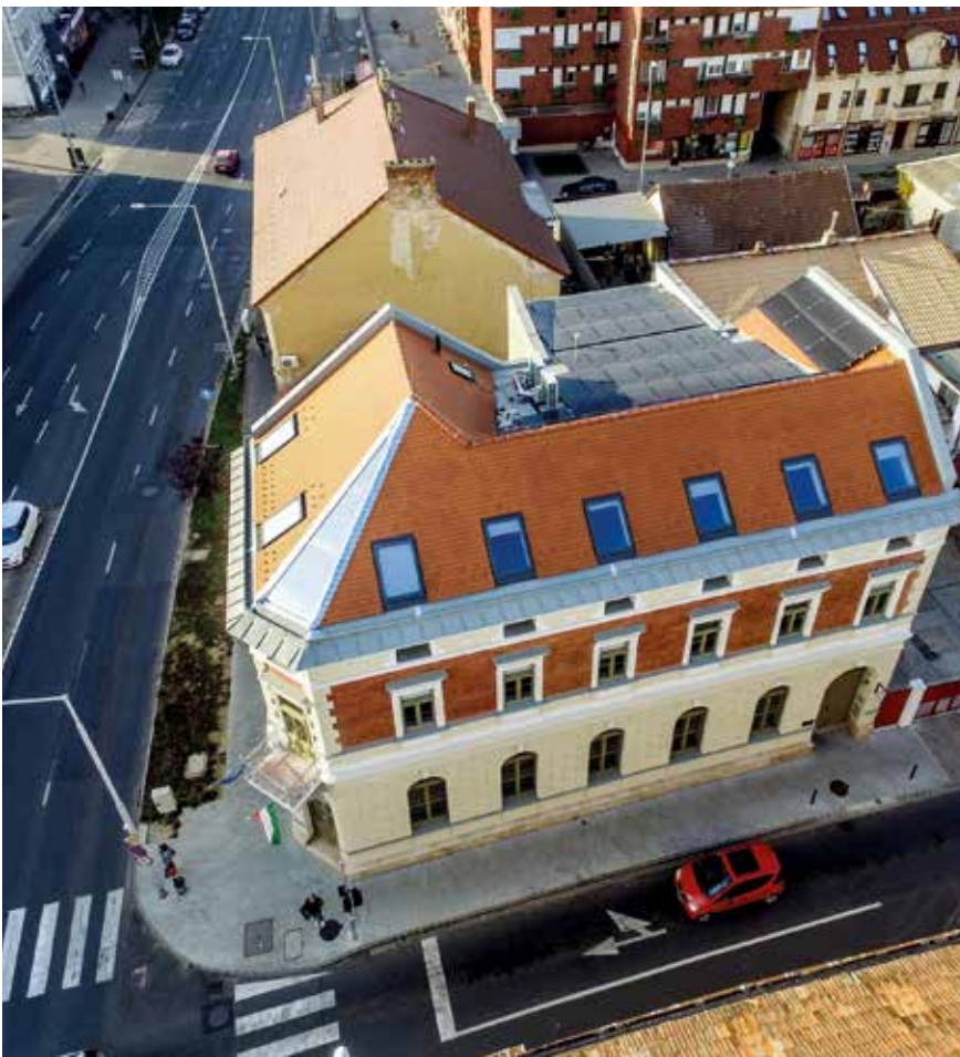
▶ Kórházelőcsarnok átalakítása, Hévíz. Turi Attila munkatársaként, 2013–2016.

◀▼ Irodaépület átalakítása és belsőépítészete, Zalaegerszeg, Munkácsy utca, 2017–2018. Építész: Zsuppányi Gyula, Fülöp Tibor, Madár Ivett, Bihari Ádám