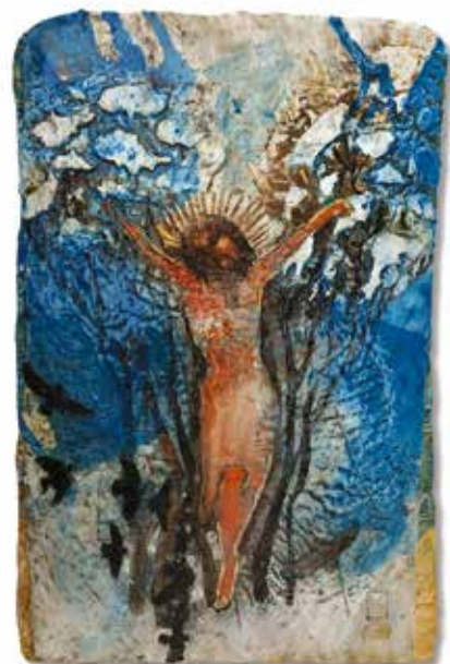
▲ Havas Krisztus Ady verséhez, 2017

Én a kommunista jászolban nevelkedő gyerek voltam. Nagymamát éjfélkor berángatták a tanácsházára, hogy most adja elő az aranyát. Látszott, hogy honnan eredt ez a gondolkodás, mert egy paraszt-asszony nem őrizgetett aranyat, mert a paraszt olyan „buta” volt, hogy földet vett, ha volt egy kis pénze. Szegény nagymamám nem merte azt mondani arra, amit az iskolában tanítottak, hogy fiam, ez