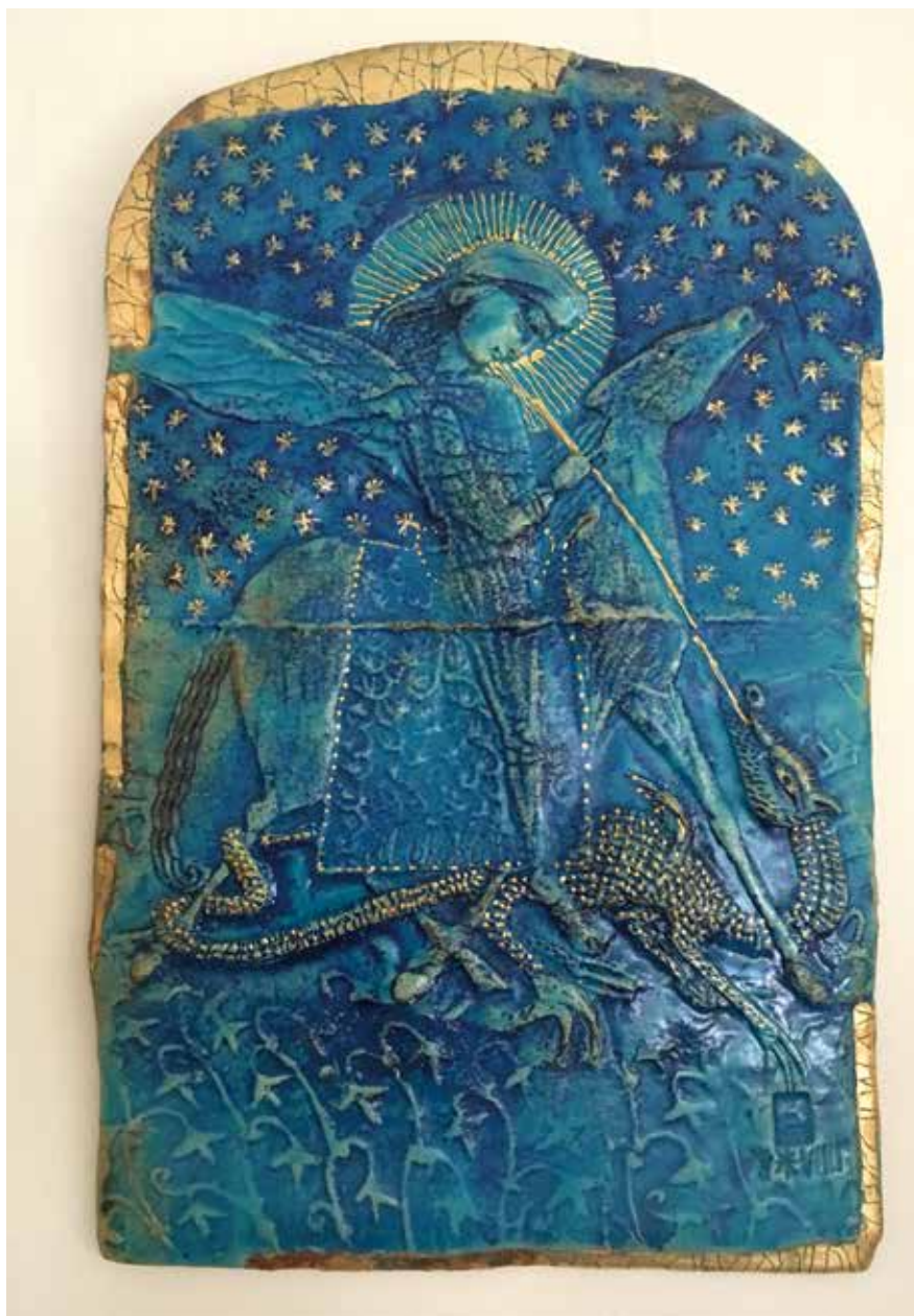
◀ Szent Mihály arkangyal, 2008

hazugság. Anyámék messze voltak. Hallottam néha apám egy-két megjegyzését, de az nem volt olyan erős hatással rám, mint a mindennapi agymosás. Tizennyolc éves korom körül a főiskolásokkal beszélgetve rádöbbenem – mindig érdekelték az összefüggések –, valahogy recseg a fogaskerék, de nem értettem, miért. Azért aljas ez az ideológia, mert a fiataloknak, akiket megfertőz, a legjobb énjére apellál. Miért gondolná egy gyerek, hogy hazudnak neki? A főiskolások, akik Pestről jöttek, sokkal felkészültebbek, tájékozottabbak, forradalmibbak voltak. Amúgy semmivel sem jobban, mint apám, csak hogy én őrá nem hallgattam még akkor. Az értelmiség nyilatkozott az 50-es évekről, hát elhittük. De a tanyán nem hitték el az emberek! Nem hitte a tanulatlan paraszt – tanulatlan, hiszen apu egyetemre is járt, csak a történelem kiragadta onnan. Szóval megértettem, hogy becsaptak. Bennem akkor olyan soha meg nem bocsátó harag gyúlt. Utána rájöttem, hogy tájékozódni, olvasni kell, akkor tudja az ember, hogy hol a helye. Ez az egész sátáni gondolkodás kiirtotta a vallásosságot belőlem.