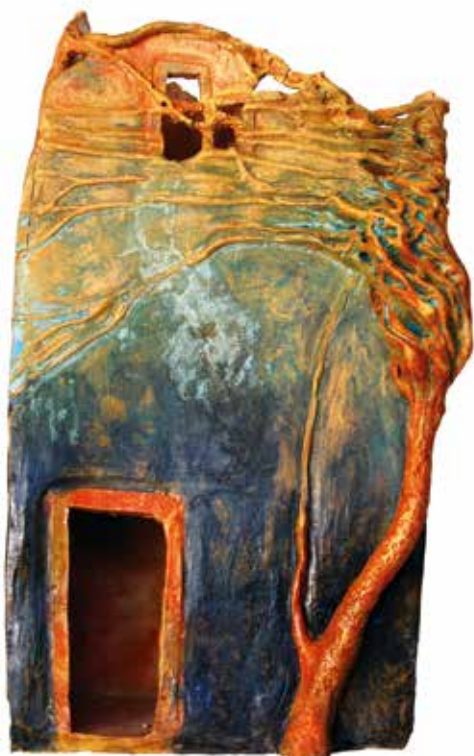
▲ Csontváry emlékezete, 2015

▶ Vettünk Évától egy kerámiát, amin egy Nagy László-idézet volt. Bizonyos sorokat el tudtam olvasni, másokat nem. Megtaláltam a verset, és a kép azzal együtt lett egész.