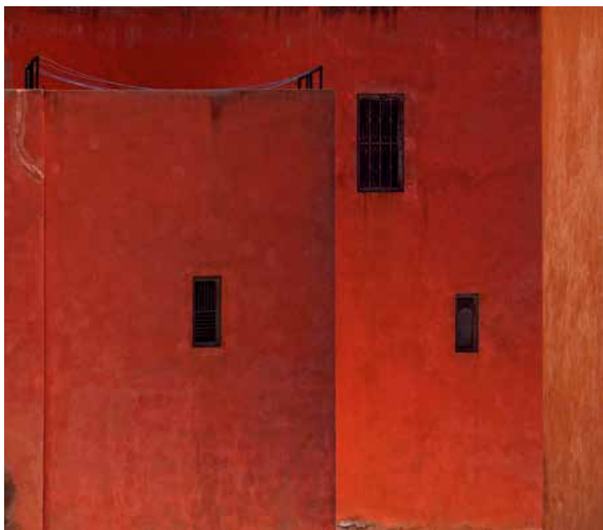
Vörös város, fotósorozat.

Megpróbáltuk a legjobbat kihozni ebből a lehetőségből. Fél évig Kecskeméten a rádióban, televízióban, újságban, a különböző fórumokon folyton erről volt szó. Tulajdonképpen az arculati kézikönyvről a készítése közben derült ki, hogy érdekes. A miénk úgy készült el, hogy csináltunk egy nyers vázlatot, amibe a polgárok bele tud-