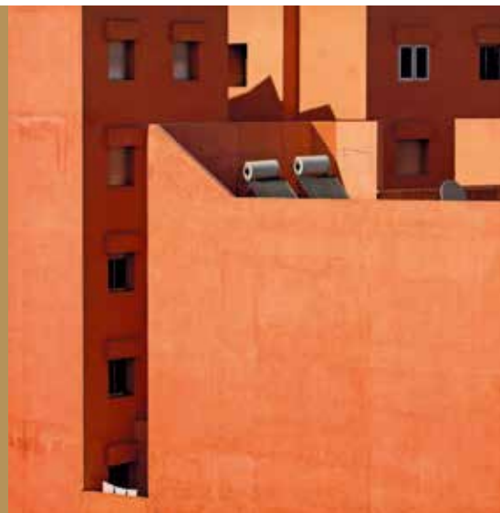
Vörös város, fotósorozat. ▲

Tanulmányok: BME 1980–81 ÉGSZÖV Tervező Iroda 1981–85 Bács-Kiskun Megyei Tervező Vállalat 1990– Öveges és Társa Építésziroda 1985–1991 Kecskemét Megyei Jogú Város, városi főépítész 1990–1994 Városrendezési Bizottság elnöke, 2009– Kecskemét Megyei Jogú Város, városi főépítész 2013– Megyei Jogú Városok Szövetsége Főépítési Kollégiumának elnöke 1994 Pro Architectura díj 2018 Év főépítésze díj