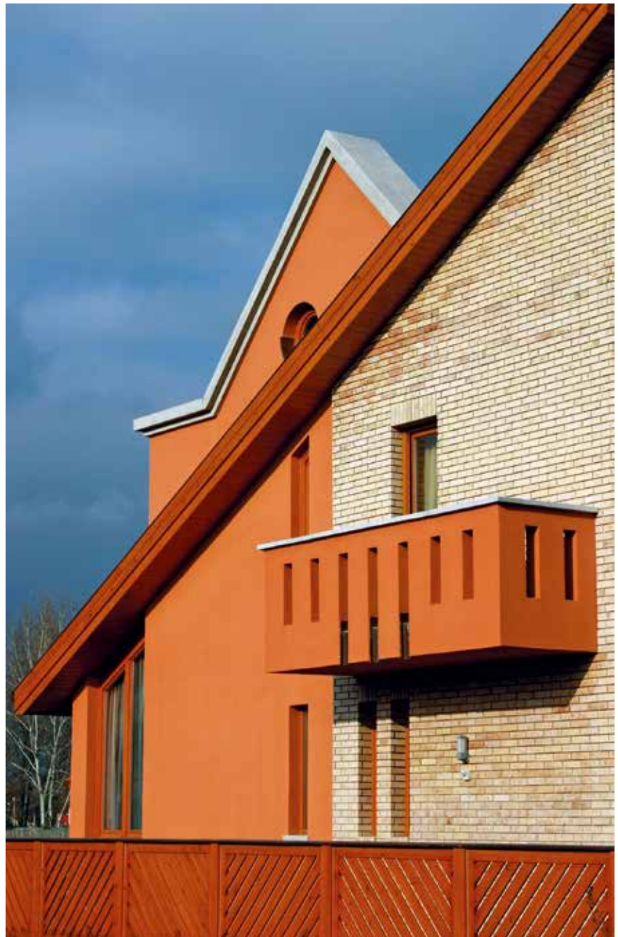
▲ Családi ház, Kecskemét. Építészet: Öveges László

támogathatónak az adott épületet –, hogy nézzük meg, mit mond erre tőlem függetlenül öt másik építész. Ha ők is aggályosnak tartják azt, amiben vitánk van, akkor fogadja el. Ez remekül működik. Az építészhatalossal való jó együttműködés része az is, hogy bármilyen ügyben kikérhetik a hivatalos véleményemet akkor is, ha a település-