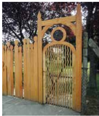
◀◀ Pince, Bárdudvarnok