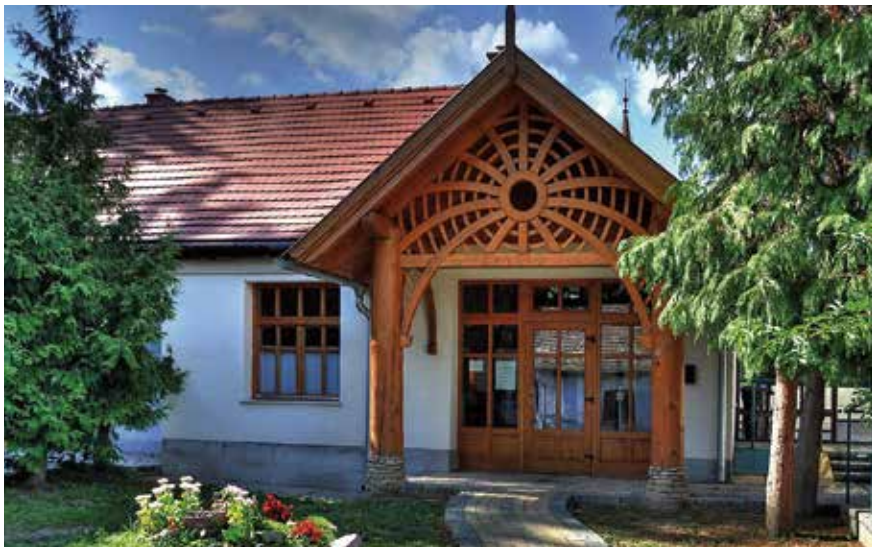
▲ Védőnői szolgálat bejárata, Kaposmérő

ember kap egy „rossz feladatot”, akkor lehet, hogy nincs a kereteken belül jó megoldás. A kereteken kívül kell keresni a választ.