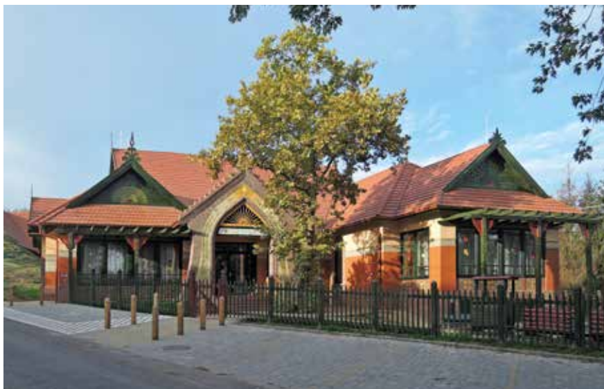
▲ Óvoda, Bárdudvarnok

Lehet, hogy el kell azon gondolkoznom, hogy kell-e ide egyáltalán ház. Lehet, hogy rossz az a kérdés, hogy milyen házat kell ide terveznem. És a rossz kérdésre sosem lehet jól válaszolni. Ha az