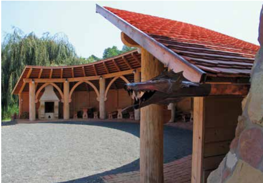
▲ Lovasjász-központ, Bárdudvarnok