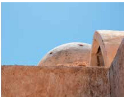
▲ Hassan Fathy saját házának homlokzati részlete Új Gournában (1945–1948)