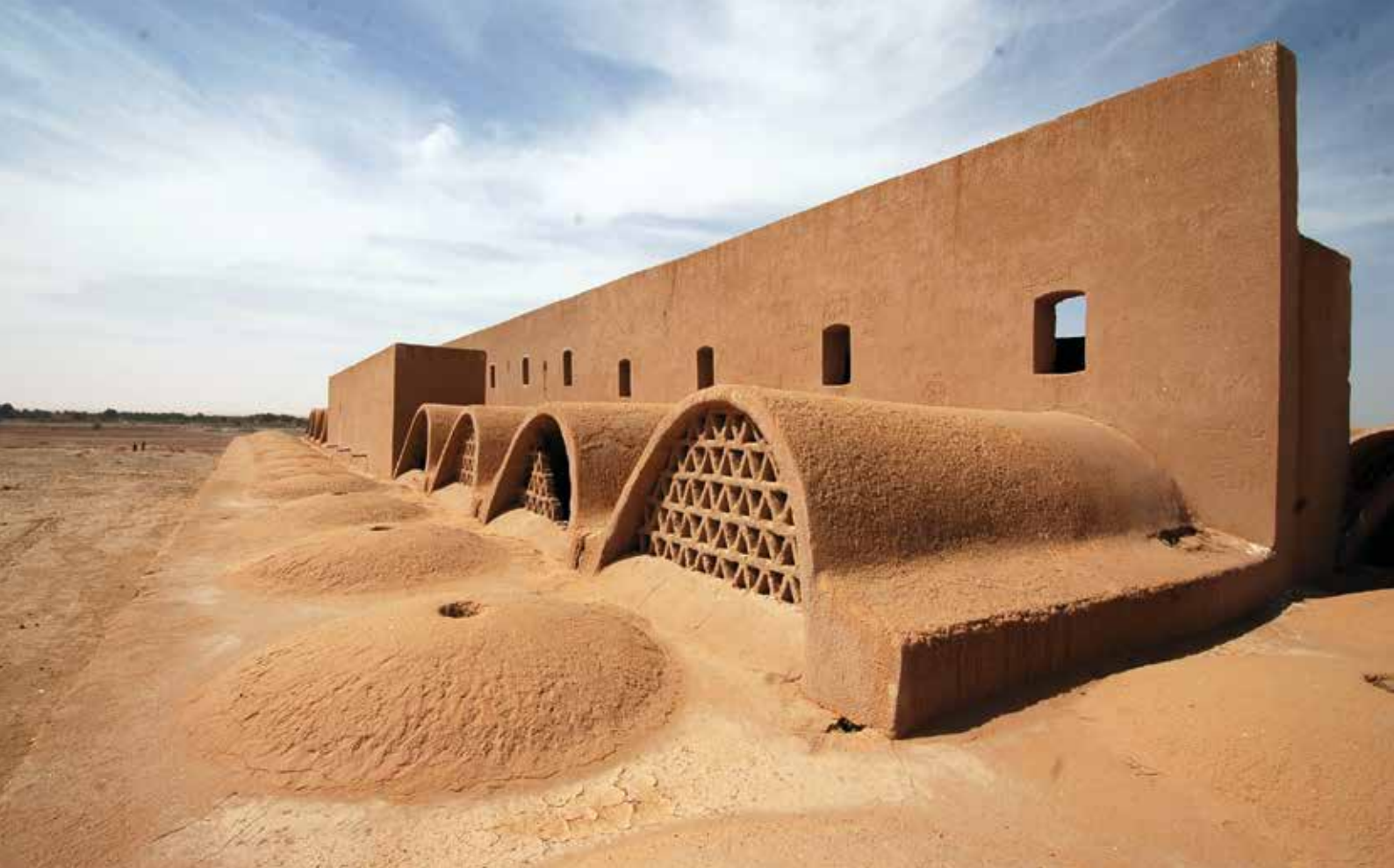
▲ A piac természetes hűtését elősegítő felépítmények (1963–67). Az épület befejezetlen maradt a hatnapos háború miatt. Új-Bárisz, Kharga-oázis

Új-Gourna (1945/46–) építése világhírűvé tette Fathy nevét, az ott részben felépült Model Village, a modellfalu a közösségi tervezés és építés archetípusának számít. A tény azonban az, hogy a terveknek csupán alig a negyede valósulhatott meg: a tervezés és a kivitelezés közben elkövetett hibák és tévedések miatt végül leállt az építkezés. Új-Gourna építéstörténete és keletkezéstörténete önálló monográfiát is megérdemelne, de röviden összefoglalva a tervezés indíttatása nagyon is profán volt. A Luxor–Nyugati parton élők jó másfél évszázada az egykori nemesi temető dombjain telepedtek meg, ahol lényegében az ottani ókori sírok ezreinek fosztogatásából éltek. Mindezt az illetékes hatóság az 1940-es években meg akarta állítani, így arra kérték fel Fathyt, hogy a törzsi gyökereket még őrző, sajátos klánokba rendeződött családok számára tervezzen egy önálló falut. Minden együtt állt az építész számára, hogy megvalósítsa álmait: a núbiai tanulságok, a vályogépítéssel iránti rajongás és a gazdag történelmi rétegzettség intenzív munkára sarkallta. A fennmaradt tervek, feljegyzések százai, és az első könyve Új-Gourna építéséről az építész eltökéltségét mutatja. A publikációk okkal modellértékűnek mutatják be a projektet,