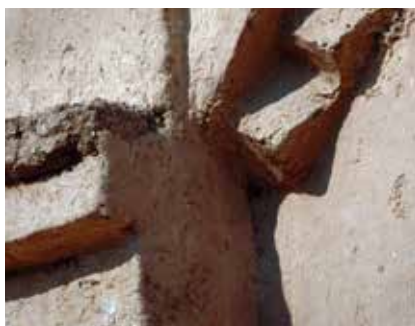
▲ Színház Új-Gournában (1945–1948), a főhomlokzat részlete (1945–1948)