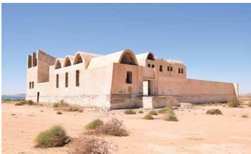
▲ Anwar Sadat elnök befejezetlen nyaralója (1981) Gerf Husszeiben, a Nasszer-tó partján

Fathy Alexandriában született, nyolcéves korában Kairóba költözik a család. Építészdiplomáját Kairóban szerzi meg 1925-ben. A kozmopolita felfogású, több nyelven beszélő építész zenélt, drámákat írt, festett, és pályafutása kezdetén több munkája egyértelműen tisztán modernista felfogású volt. Első megbízatása egy általános iskola tervezése volt Talkhában, emiatt 1926-ban tanulmányúton vesz részt. Érdeklődése már ekkor a vidéki, a rurális életforma, és annak építészete felé fordul. 1930 és 1946 között az École des Beaux Arts in Cairo tanára. Az 1930-as évek végére konkrét prototípus-kísérletekkel a vernakuláris építészettel kezdett foglal-