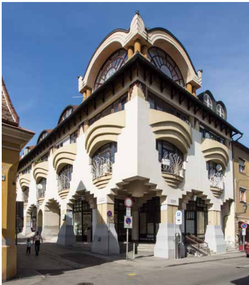
▲ Bikafejes ház, Pécs, 1981-85.

lesz? Ha Makovecz megcsinálja az övét (MMA), akkor mi is a miénket – mondták. Felhívtam Imrét, mondván, nagy megtiszteltetés, hogy engem ide meghívtatok, de nem lépnek be sem ebbe, sem abba. Aztán 1997-ben, amikor Jancsó Miklós volt a Széchenyi Művészeti Akadémiának (SZIMA) az elnöke, úgy látszódtott, hogy közeledik egymáshoz a két akadémia. Ekkor, nagy megtiszteltetésnek véve, elfogadtam az MMA meghívását. Azon az ülésen, amikor engem felvettek, jelen volt Jancsó Miklós mint a Széchenyi Művészeti Akadémia képviselője. Egy szóbeli nyilatkozat is született, hogy a két akadémia közeledik egymáshoz, és az egyesülés sem volt kizárva. Akkor már több mint ötven tagja volt a Magyar Művészeti Akadémiának, nekem már a Kecské utcában szék sem jutott,