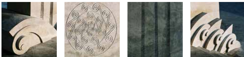
▲ Részletképzés. Szent Gellért tér és Forrásház, Budapest, 2003.

Építész: Dévényi Sándor. Munkatársak: Halas Iván, Baranyai Bálint. Kerámia: Dobány Sándor.