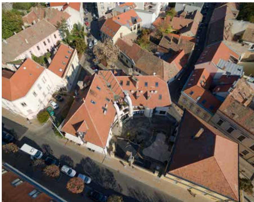
▲ Lakodalmas ház, Pécs, 1984.

► Az interjú elején már említett versenyfutást hallok ki a szavaidból, amit az emlékek megmaradásáért meg kell nyernünk. Egyfajta emlékezetvesztés idejét éljük, már vagy hatvan-hetven éve.