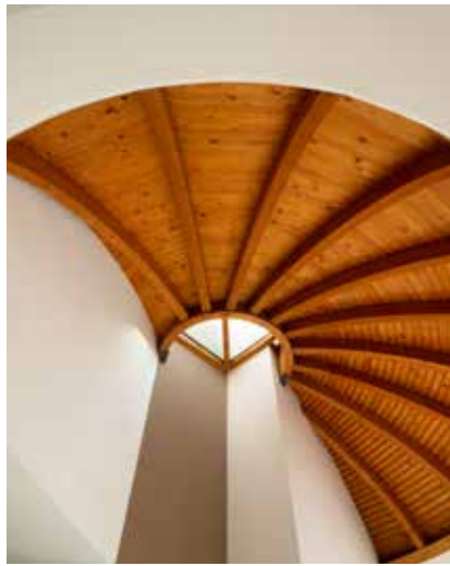
▲ Millennium Hotel, Pécs