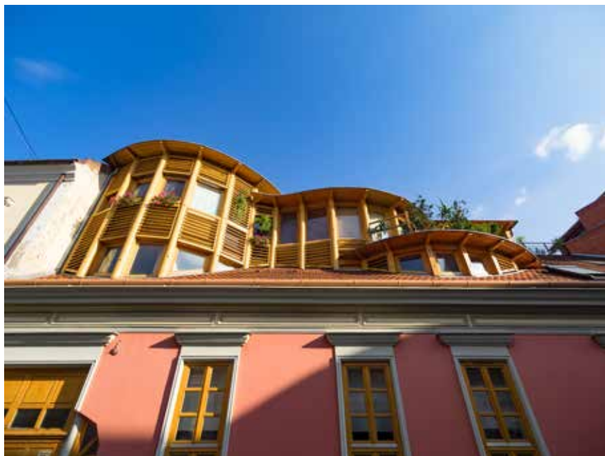
◀ Társasház, János utca, Pécs, 2000–2006. Munkatárs: Halas Iván.

A műemlékeket, az épített örökséget csak egyszer tudjuk megmenteni, mert ma nem termelődik újra. Egy jó ismerősöm még a rendszerváltozás előtt járt Washingtonban a művészeti múzeumban. Megkérdezte a teremőrt, hogy hol van az építészeti részleg. A teremőr kérdően nézett rá, és azt mondta, hogy hát az építészet nem művészet, az csak biznysz. Nyilván mindig lesz egy olyan megbízói réteg, amelyik szeretné, ha az ő gondolatísága is megjelenne az általa építtetett házban. De ezt az öszsvolumenhez képest elenyésző számnak tekintem.