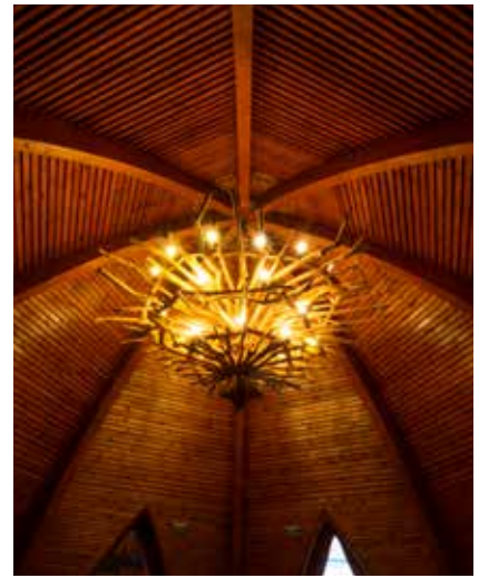
▲ Dráva Kapu Bemutatóközpont, Drávaszentgyörgy

Pécsre. Ez persze csak egy egyszeri alkalom volt, meglehetősen kis összeget, 33 milliárd forintot jelentett. Ma csak a kecskeméti egyetem kap 100 milliárdot fejlesztésre, ahol nem volt sohasem egyetem. A pécsi egyetem ezzel szemben 24 milliárdot kap, és azt is a város adja a Modern Városok Program ból.