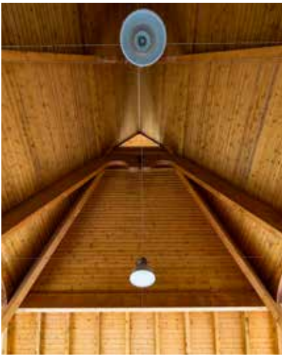
▲ Fürdő, Marcali