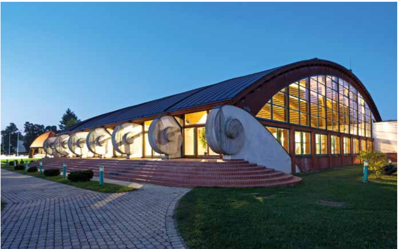
▲ Gyógyfürdő, Barcs, 2000–2006. Munkatárs: Halas Iván, Baranyai Bálint.

Csete Györgyéknek is kellett az a klíma, az a társadalmi környezet, amely a 70-es években kezdett élni. Ez eltérő volt a kommunista és a kapitalista világban, de mindenhol egyszerre kezdett mozgolódni. Nekünk talán könnyebb dolgunk volt, mert nem volt annyi szempont. Egy hatalom, egy irány volt, egyféleképpen kellett gondolkozni. Ebből könnyű volt kitörni. Az internacionális építészetnek nevezett irányzat kezdett kiüresedni. Egyszerűen elfogytak a vonalak. Úgy voltunk vele, mint ma a minimállal..., remélem, az is kezd kifulladásra.