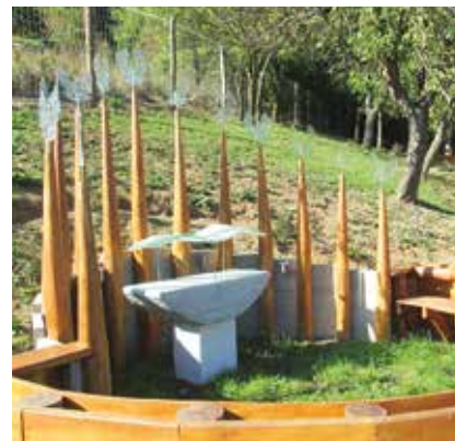
▲ Mária mennybevétele

Mária mennybevétele – kör alaprajzú stáció nagy lapokkal burkolt terének a hegyoldalba ékelődő felében van a vallási kompozíció, míg a másik térfelet