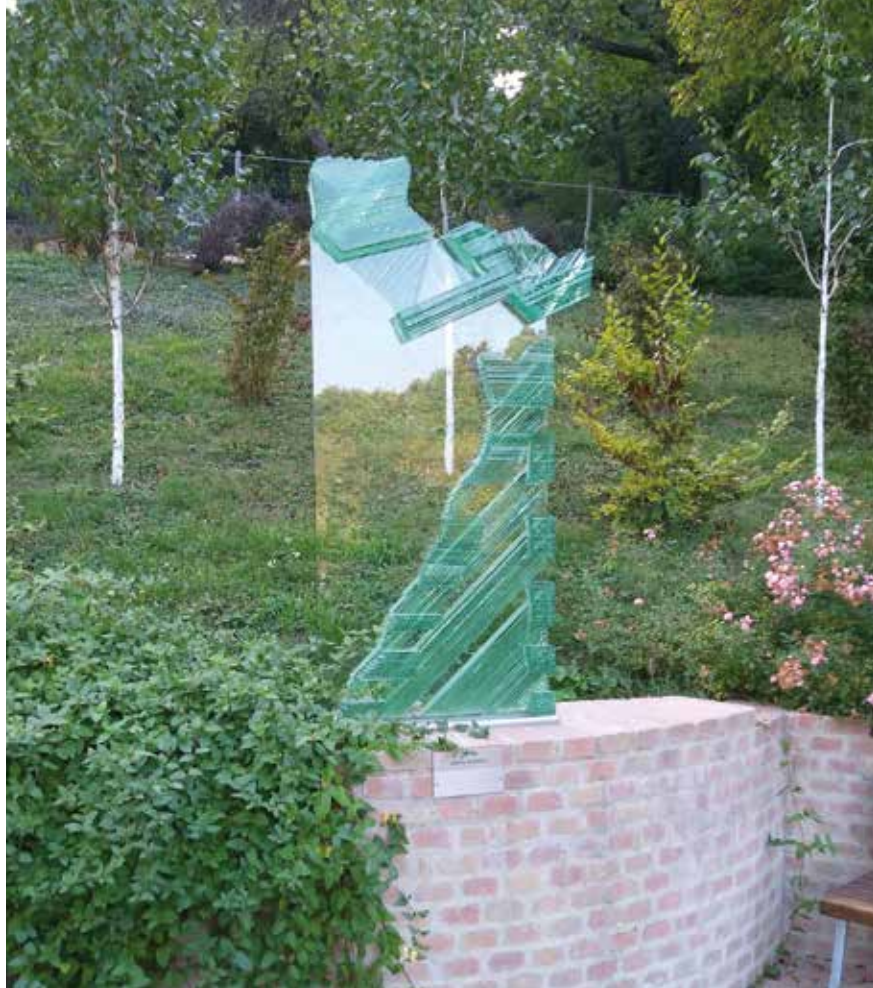
▲ Angyali üdvözet

Fűfugás, sárgás dalmát mészkölap burkolatú az ösvény, hasított, érdes felülete a praktikumon túl szervesen, természetesen illeszkedik környezetébe, állandó kertészeti gondozást igényelve. A stációk teraszain változatos az anyaghasználat: régi és új építőanyagok együttese szerepel: természet, bontott téglák, rusztikus hatású, fűrészelt homokkő, színezett betontégla, mészhomok téglák adja az építészeti keretet az egyes helyszíneknek,