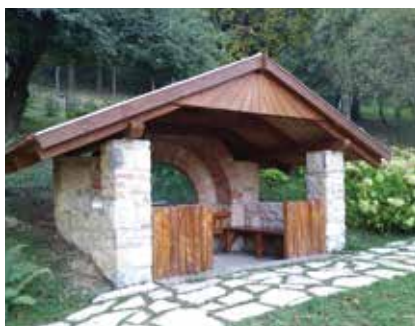
▲ Jézus születése, Betlehem

A 12 éves Jézus a templomban – ez a legtágasabb terű stáció, ahová lépcsősoron kapaszkodhatunk fel, ahogy a templomot is így közelíthetjük meg legtöbbször. Itt fordul vissza a magasabb rétegvonalon a sétány. Harántirányban kétoldalt a padok helyével bővülő téglalap alakú terét 45 fokos kiosztásban négyzetes mosott kavicsos beton járólapok burkolják. Négy fehér vakolatú, vaskos, kerámialábazatos betonhenger utal a templom oszlopos homlokzatára. A támfal fölé magasodó részük között lécrács a kúszónövények számára. Középen egyszerű, „antikolt” betonasztal-oltár. Felette az oszlopokra erősített üvegdombormű a legnehezebben megfejthető: átlós irányú rácsos felületébe íródó körökből egy arc sejthető.