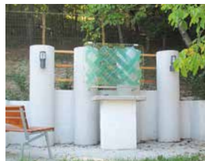
▲ A 12 éves Jézus a templomban

Keresztút: Mária a keresztnél – ívelt terméskő támfalon áll az üveglap, rajta a több réteggel körülrajzolt kereszt tövében lerogyó, imádkozó Mária megindí-