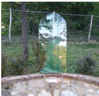
▲ Keresztút: Mária a keresztnél

Kánai menyegző – kétszer megtört vonalú, befelé szűkülő, körcikk alaprajzú tér, valamint a közép felé emelkedő betontégla támfalak vezetnek az ívelt kapuhoz, ahol a kinyíló üveg ajtószárnyakon tűnik fel Mária és fia alakja. Az építmény fölé pergola nyúlik, szabálytalan kőlap a járófelület. A jelenet tartozékként tervezett három-három, bő szájú, még hiányzó kerámiaedény formája sem akarja történetileg követni a bortároló edények formáját.