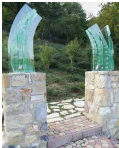
▲ Szepőlötelen fogantatás