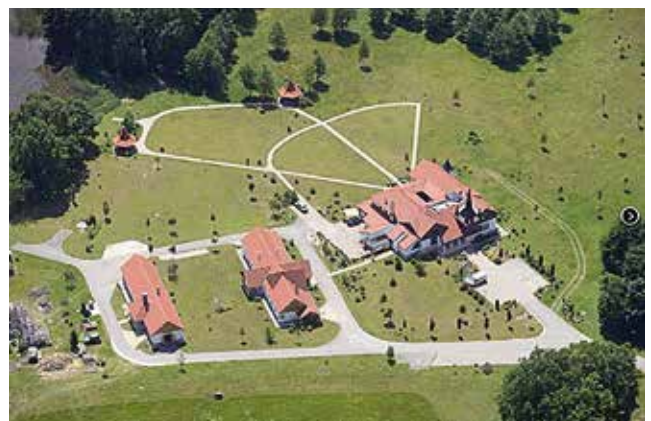
▲ Légi fotó