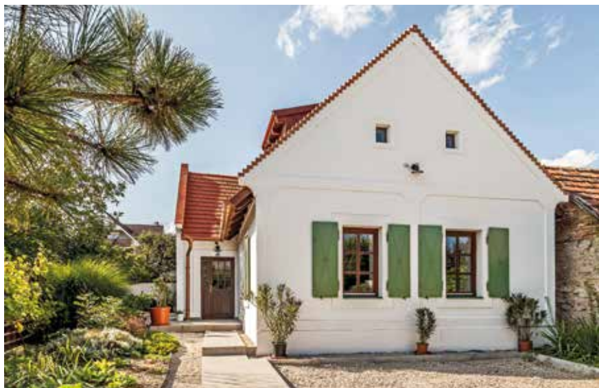
Lakóépület, Balatonfüred. Építészet: Kis Kálmán, Tóth Péter, 2017.

válaszom: nem. Annak a mai formájára nem tudok értéként tekinteni, elsősorban a gyakorlatorientáltság hiánya miatt. A Vándoriskola lenne a működő modell, mint azt a saját példám is mutatja. Talán ide sorolható még a székelyföldi kalákákban való részvételem. Ezt azért tartottam értékesnek és támogatandónak, mert itt a gyakorlatban tapasztalhatjuk meg a tervezés komplexitását. Nem elég jól rajzolni, olyat kell rajzolni, amit meg is tudsz építeni. Ennek elemi erejű példái a kalákák. Ezenfelül nagy-szerű közösségi események.