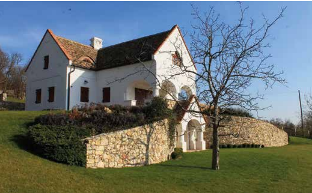
Lakóépület, Dörgicse. Építész: Szűcs Endre, Tóth Péter, 2011.

től klasszikus tervfeldolgozó munkát nem kaptam, de nem is ez a jellemző az irodára. A Mérműben az első vázlatok készítésében ugyanis mindenki részt vehetett. Az aláírás nélkül bemutatott lapokból pedig a megbízó döntötte el, hogy kinek a koncepciója valósuljon meg.