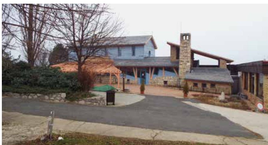
▲ Hilltop Neszmély borhotel és étterem, Neszmély, 1997