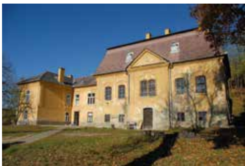
▲ Eredeti állapot