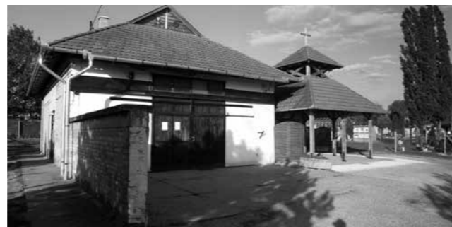
▲ Átalakítás előtt

Életünk egyre személytelenebb része a halál. A haldokló gondozása, ápolása, az emberséges búcsú, majd a ravatalozás, a gyász egykor a család és a helyi közösség feladata, életének része volt. Manapság ezeket a szolgáltatásokká degradált teendőket kiveszik a kezünk közül. Nincs már otthoni siratás, méltóságos halál az elmenőknek, és a búcsú lehetősége az itt maradóknak. E folyamatok méltatlan körülmények között, kórházakban, öregek otthonában, végül a ravatalozókban zajlanak. Pedig a búcsúra, az utolsó időszak személyességére, a gyászra nemcsak a haldoklónak van szükségük, hanem a családtagoknak, a túlélőknek is. A falusi temetkezési szokások a 20. század derekán változtak meg. Az 1960-as években állami rendeletben tiltották meg a halottak háznál tartását. Az addig élő, évszázados hagyományok szerint a halottas szobában a virrasztást és siratást követően az elhunyt koporsóját a tornácról nyíló halottajtón keresztül kivitték, majd a Szent Mihály lovára állították. Az udvaron tartott siratást és egyházi ceremóniát követően a menet a portáról gyakran a templom érintésével a temető felé vonult, majd a sírnál végső búcsút vett a halottól, végül visszatért a halottas házhoz, megülni a halotti tort. A modern idők folyamán magánházak helyett ma ravatalozókban búcsúzunk szereteteinktől. A kistelepüléseken, falvakban megjelentek a raktárra, garázsra, műhelyre emlékeztető rideg épületek,