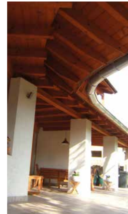
Parasztház felújítása, Nadap, 1992 ▲