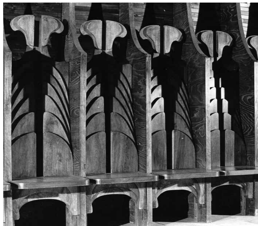
▼ Ravatalozók ülőbútorai, Farkasrét, 1976