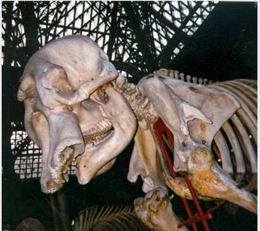
▶ Elefántkoponya Museum of Natural History, Oxford

empátiával, észak-koreai diktatúrákat megszegyenítően azonos ruhát kényszerítenek a falakra és tetőkre. Az átmenet mint felesleges álprobléma nemcsak mellőzhető, de nincs is számára hely. Az ablakok és falak határán a historizálók bonyodalmas peremezéseit nemesen egyszerűnek vélt szegések váltották fel. A modernnek a fal és nyílás közötti átmenetet is az épületen történő lokális játszadozásnak, perverzióknak találták, libidópótló élményként az épülettömeg-játékot kínálták. Az átlátszatlan faltól az átlátszó üveg és még átlátszóbb üreg felé átmenet mint szecessziósan halál-szagú és nyálás-ragadós kinlódás mellőzendő lett.