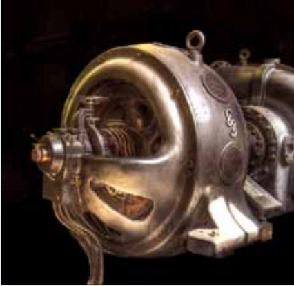
▲ Őreg Siemens Schuckert generátor részlete Henrichenburg, Németország

Egy emberfej-nagy, belsejét vesztett generátor volt gyermekkorom titokzatos szörnye. A száz éve még zúgó gépkoponya elődje lett egy kihalt ósállatkoponyák mellé illesztett, kihálásra váró elefántok egyikének koponyája, amely egy oxfordi múzeum állatcsontvázaiban egyikén tartózkodik, varázsos felületátfordulásokkal. Mint a formák világának talán legbonyolultabb, egy egészbe font alakzata tetemre hívott: tudsz-e olyan emberi életfunkció-kompozíciót fellelni, amely a befoglaló vagy a vázat alkotó építménytől hasonlóan bonyolult formát követel? Tudsz-e köpenyt adni az emberi létezésférák egymásba átsimuló együtt zsongásának a funkcióknak csikorgó keretet adó dobozalakzatok helyett?