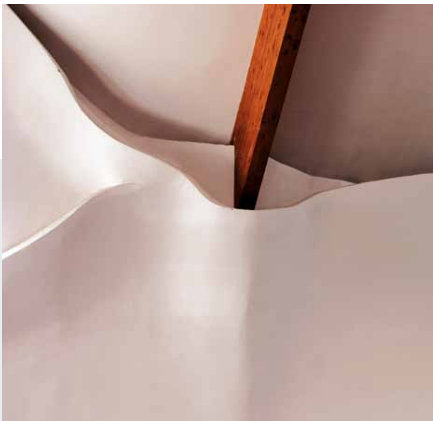
▼ Debrecen, Rákóczi utca. A láthatatlan felé hatolás gesztus. Építészet, fotó: Kőszeghy Attila