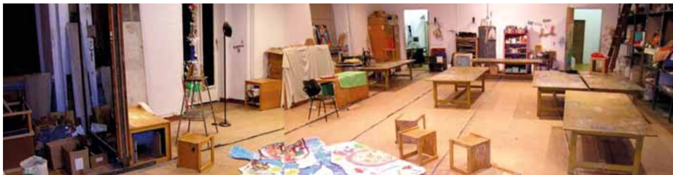
▲ A műhely