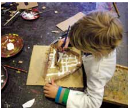
▼ LakóKamrák: Panel vagy lakópark? Egy lapfelület térré transzponálása és abból árnyékinstallációs riport készítése, 2015 CsodaKamrák | Eplényi Anna, Schmidt Gertrúd

elvonatkoztatnak attól, azaz a feladatban már csak egy érzékszervi tapasztalás, egy forma, egy részlet, egy struktúra marad, ami viszont az absztrakció felé nyit utat. Jó és egyedi műalkotás csak abból szülehet, ami elvonatkoztatáson, átértelmezésen alapszik.