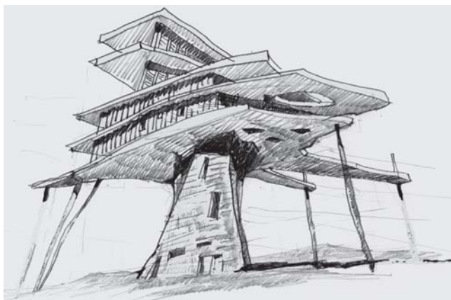
A szerencsi katolikus templom belső tere, a tihanyi régi kikötő rendezési pályaterve és a Paranora fantáziaterve.