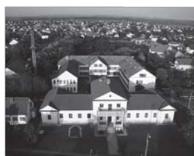
Fent: A Miskolc-belvárosi református gyülekezet ifjúsági missziós központja(2003). Lent: a felsőzsolcai volt Bárczay-kastély felújításával készült könyvtár (2002)