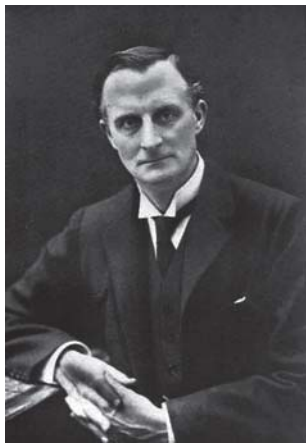
Sir Edward Grey

A viszony megromlása úgy kezdődött, hogy az angolok 1895-ben előre kitervelt módon megtámadták a búrokat Dél-Afrikában, majd 1899-ben újra, aminek áldozatul estek a német