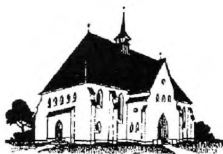
Kós Károly metszete a siklódi templomról