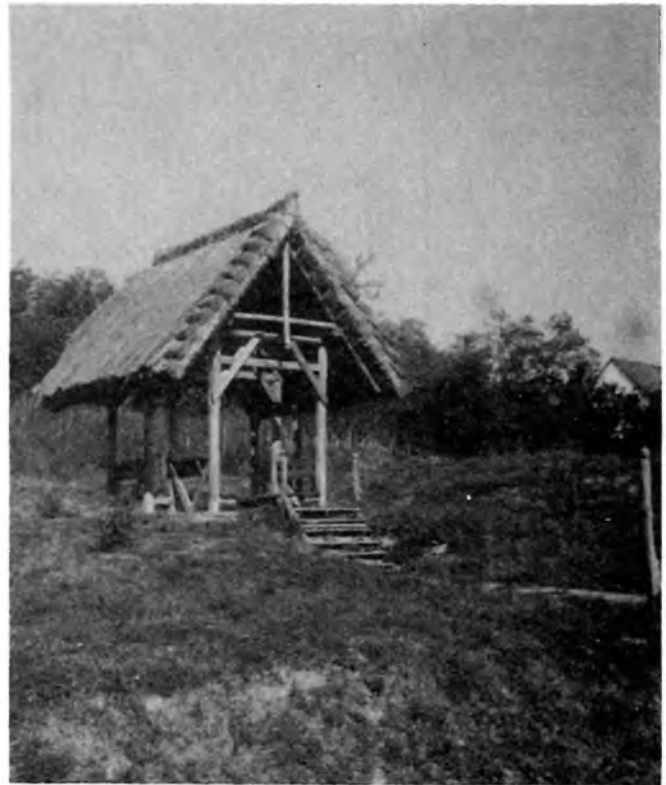
A kész kugliház 1991

vitás, a gyors, időszorította döntési helyzetekben a legjobb megoldás megtalálása, az évfolyamközösség erősítése volt. Nem elhanyagolható szempont egy másik Magyarország valós állapotának felvillantása, a kistelepülések sorsának megértetése. Mindezekre jobbára csak jelzesszerűen jut idő, de még így is több, mint a semmi. Elgondolkoztató, hogy idén nyáron már két környékbeli településen is dolgoztak elszánt skót fiatalok – a PHARE program keretében – Széplakon és Gyűrűfűn, – ahol közösségi hajlékokat építenek. Talán az ő segítségük is hozzájárulhat a táj újbóli, étellel való megtöltéséhez. S ha fontos lehet e vidék sorsa a távoli skótoknak, miért ne lenne fontos a magyar főiskolásoknak?