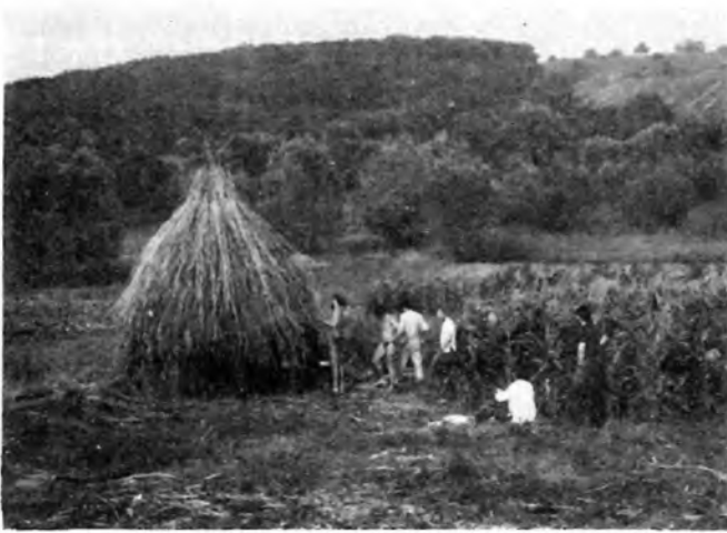
Biobudi építés közben és vesszofonatos ajtaja 1981

Ezután valami építészeti feladatot kerestünk – így született meg a csúnyácska, bár hasznos kocsmáépület melletti kugliház ötlete. Újfeni a hallgatók találékonyságára volt bízva a szerkezet kitalálása, s rövid napok alatti összeácsolása. Itt anyagot kellett beszerezni a szomszéd fűrésztelep-