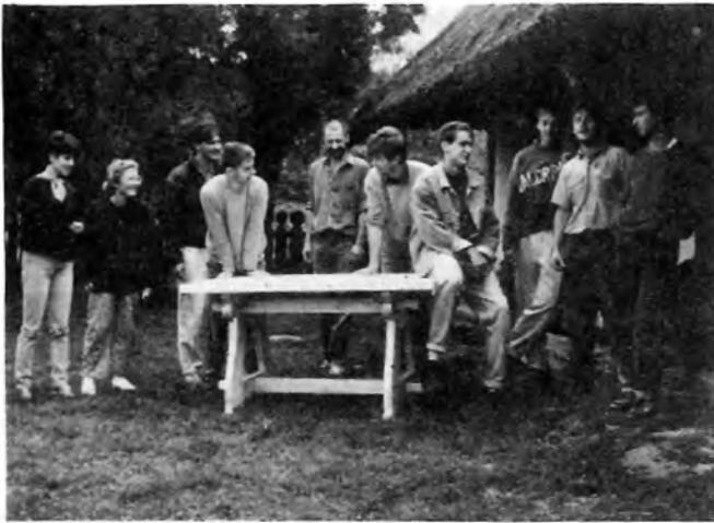
A templomi asztal

A nyári együttlétek később beépültek a főiskolai tanmenetbe gyakorlat címen és hasznosabbnak tűntek, mint fűrészport söpörni egy BUBIV gyár-egység udvarán, megtűrt, kellemetlen tehernek lenni egy széteső iparágban. Lukafán a faipari műhelymunka alapjaival a valóságban találkoztak a növendékek, valós, használati tárgyak készültek el közösségi munkával s hozzá mindig kiegészítőül szolgáltak a varázsos, pánerotikus barangolások a dombok között, a fejjel érő csalánosokban, bele-bele pottyanva az elhagyott kutakba, megbotolva a lakatlan falvak otthagytott nyomaiban.