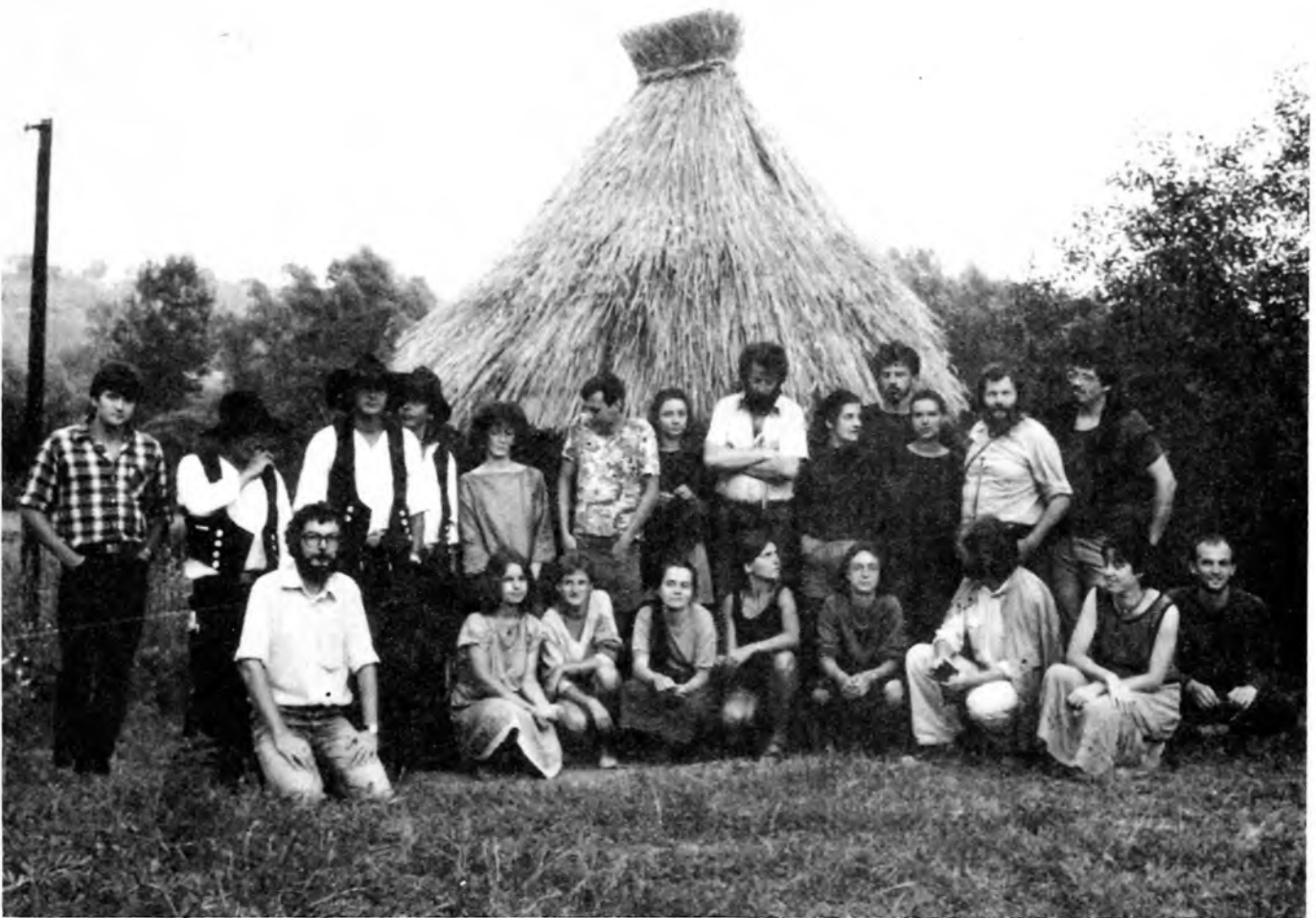
A kész budi és közönsége

ről, azokat méretre vágni a műhely-múzeumház faműhelyében, elegyengetni a terepet és végül összeeszkábálni az építményt. Ez már a falu szeme előtt készült, tudtuk, egy darabig ott is marad – nem lehet haszontalan az építmény.