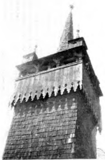
Tiszacsécs, református templom

rögtön árulkodnak: ez a XX. század. A természetes adottságok többé nem meghatározók, a falu fejlődését hivatalnokok mérik ki. Márpedig a XIX. század nagyarányú fejlődést hozott, a falvak terjeszkedtek. De egyre nagyobbak azóta is, hogy a helyzet a visszafára fordult. Századunkban általában erősen csökkent a népesség, és mégis nőttek a falvak. Amíg ugyanis régen átlagosan tíz ember[!] élt egy telken, addig ma három. Ha tehát felére csökken egy falu lélekszáma, házaik akkor is gyarapodnak. Új utcák majd minden községben láthatók. Szervetlenül, erőszakosan meredeznek az ősi, hajladozó utcák mellett. Természet és ember kapcsolata lazul, s ez látszik az épületeken is. Az emlékezetes, hatalmas pusztitást végző tiszai árvíz után lakóházak százai épültek újjá a sátorotló monoton diktatúrájában. Ebben a helyzetben is van okunk örülni. Szinte teljesen hiányzik a mai póffeszkedő, magamutogató, nagyzási mániában szenvedő házipítési szokás, mely az ország más területeire általánosan jellemző. Ennél mindenképpen sokkal jobb Szatmár-Bereg építészet, mely ugyan nagy átlagban jellegtelennek mondható, de mégis magas a népi építészet megmaradt emlékeinek aránya. Ez azt jelenti, hogy itt még van lehetőség a javításra, hiszen legújabb mai kultúránk(?) ide még nem tört be. Sok település határára Tisz-telepek, gépjárműsok fogadják a látogatót, ezek általában rendetlenek, gazdasági épületeik csúnyák.