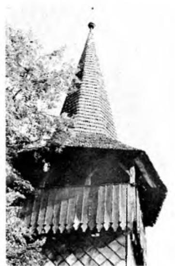
Unka, református templom