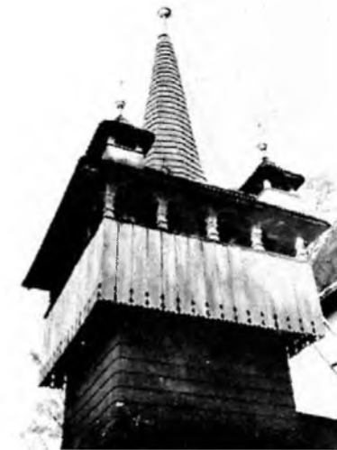
Nagyszekeres, református templom