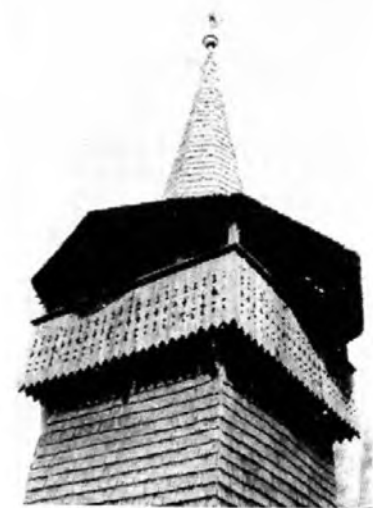
Kölcse, református templom