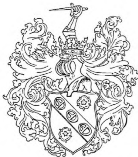
A szerző rajza

A gódlík, tulrok, völvák, szkaldok, vagyis papok, bölcsök, jósnók és dalmokok szellemi látásában Thórr egy volt a tűzekkel, a mennydörgéssel, a villámlással, a viharral, a meleggel. Neve kb. azt jelenti: "ordítani, bögni, dörögni". Nem kovácsisten ő, mint Hephaistos 4 , akire sokban hasonlít, mégis van egy romboló, feloldó erőt és hatalmat jelképező kalapácsa, a Míólnir, a "Morzsoló", amivel harcöl és a tavasz első napjain, hatalmas roppanások kíséretében feltöri a jeget a tavakon, folyókon, s a tavaszi viharokban mennydörgéscsikkel, villámlásokkal ad hírt magáról. A természetben ő a láthatatlan, csak hatásaiban ismert tüzes alakítóerő, annak a határnak az ura, amelyen át - az emberben és a világban egyaránt - a testetlen ősfényből "fizikai" ill. fizikailag érzékelhető hő lesz, ő maga ez a testi, vagy légtörő, meleggé vált erő, amely az emberben egy intuíciónál, felismerésből fakadó tett