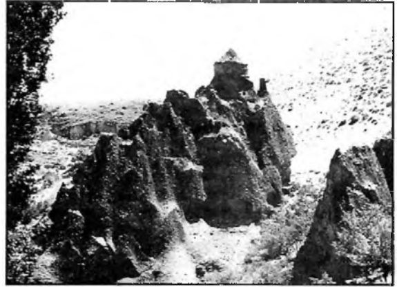
1. kép Sogani, Kubeli (kupolás) templom

Egyelőre húzódjunk meg csendben az egyik sarokban, és maradjunk veszteg. Várjunk türellemmel, míg ide is megérkezik... Kicsoda? Hát ő – a "fény az örök fényből" – ahogy az egyházatyja mondta. Közben, ha már hozzászokott a szemünk a félhomályhoz, szetpillanthatunk acsipetnyi térben, és ha finnyás természetűek vagyunk, akár mindjárt meg is botránkozhatunk. A falon "össze-vissza" sorakoznak a ké-