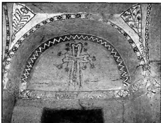
6. kép A keresztet "kivirágítik"

változásainak megfigyeléséhez szolgáltát ósidók óta igen alkalmas segédletet; ha pedig időben értelmeczzük, az évkört jeleníti, amelynek egy-egy cikkelye pontosan egy-egy évszaknak felel meg. Amint hogy a göremei Szent Eusztathiosz templomban is minden egyes boltozati körcíkkely alá egy-egy évszakjelző ábra esik, a pontosan oda illeszkedő csegelekbe.