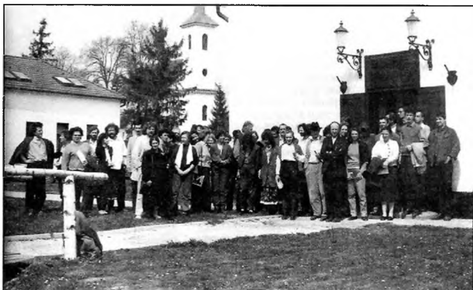
Csoportkép az 1991. tavaszi Cálósai találkozó résztvevőiről