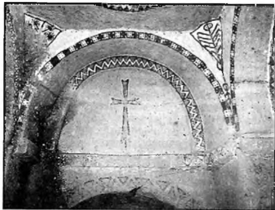
5. kép Göreme. Szent Eusztathiosz templom, a "kopasz" kereszt...