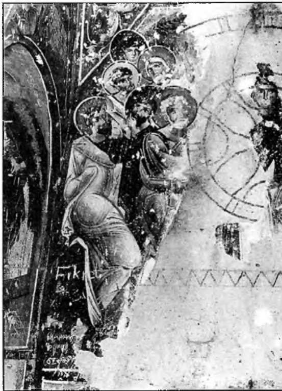
3. kép Göreme, Elmali templom

Másrészről viszont feloldható az "ábrázoló", illetve "absztrakt" stílusfokok közötti ellentmondás azoknak a tanulságoknak a figyelembe vételével is, amelyeket az imént a Göreme-völgyi Elmali templomban nyertünk. Eszerint mindenképpen praktikus megoldásnak látszik először a lehető legegyszerűbb képjelekkel rögzíteni a napi-évi fényjárás legfontosabb állomásait a templom mennyezetén, a falakon, a padlón, illetve az oszlopok fejezetein, azután pedig – figyelni. Sokáig csakis figyelni: mi történik a való világ életében, amikor a fény sugar erre vagy arra a jelle "lép rá" ... és gyűjteni-gyűjtőgetni a tapasztalatokat.