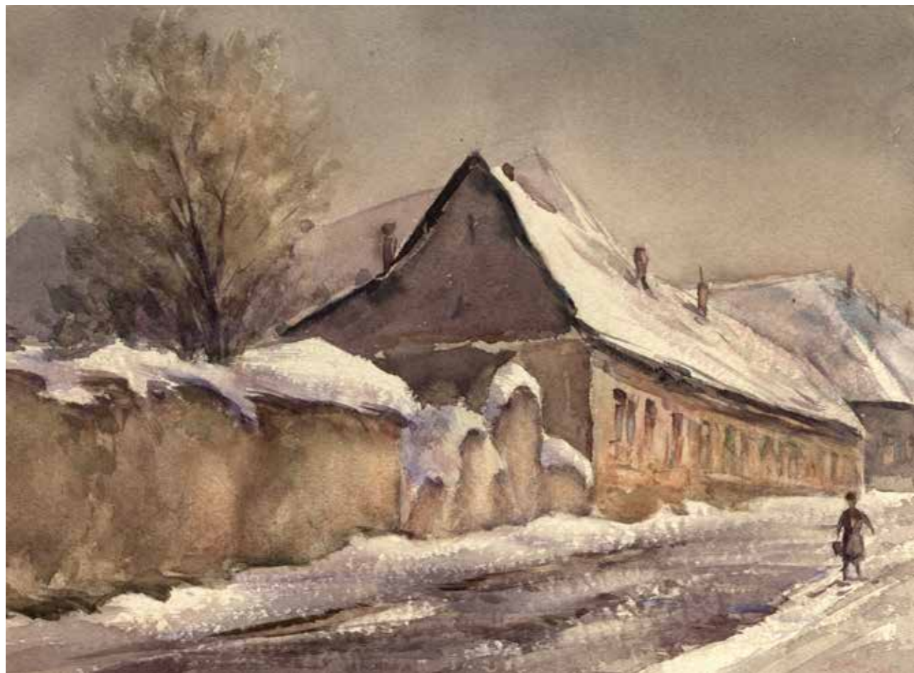
FÉNYES ADOLF UTCA A DUGOVICS TÍTUSZ TÉR UTÁN, AKVARELL, 35 × 26 CM