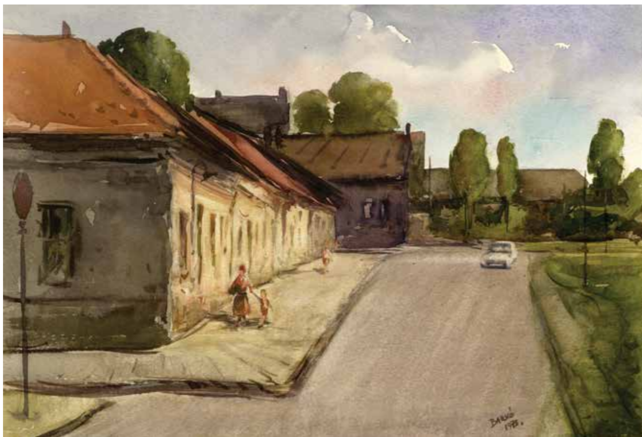
TAVASZ UTCA A SZENTLÉLEK TÉR FELÉ, AKVARELL, 38 × 27 CM