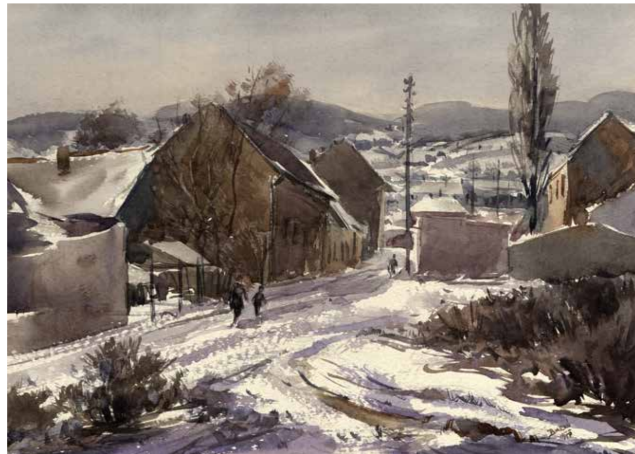
KÖRTE UTCA, AKVARELL, 38 × 27 CM