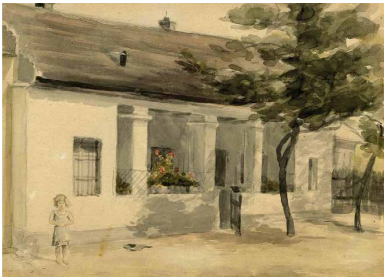
TORNÁCOS HÁZ PARAJDON (ERDÉLY), AKVARELL, 27 × 19 CM