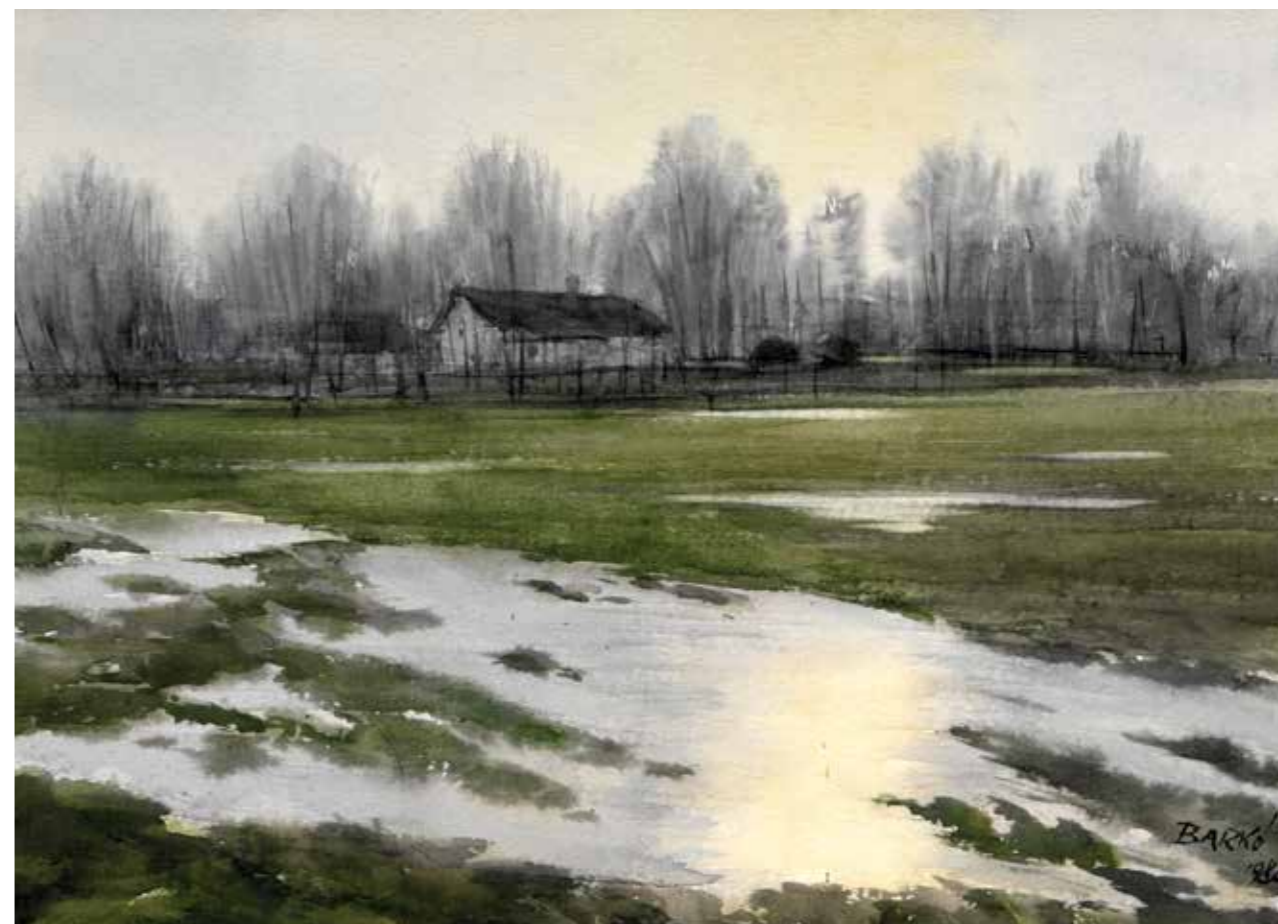
TANYA MÁRTÉLY MELLETT, AKVARELL, 42 × 28 CM