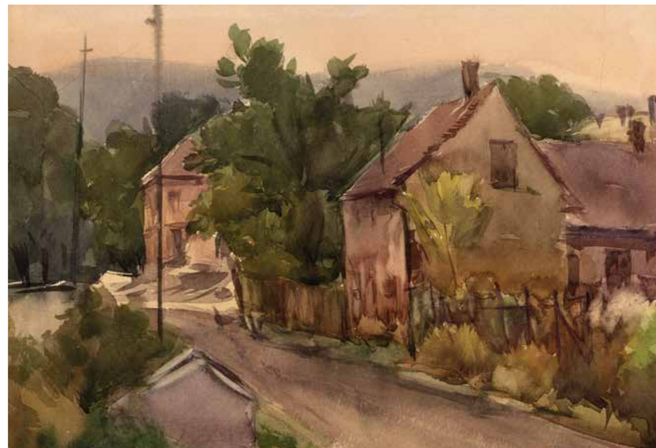
MÓKUS UTCA, AKVARELL, 36 × 27 CM