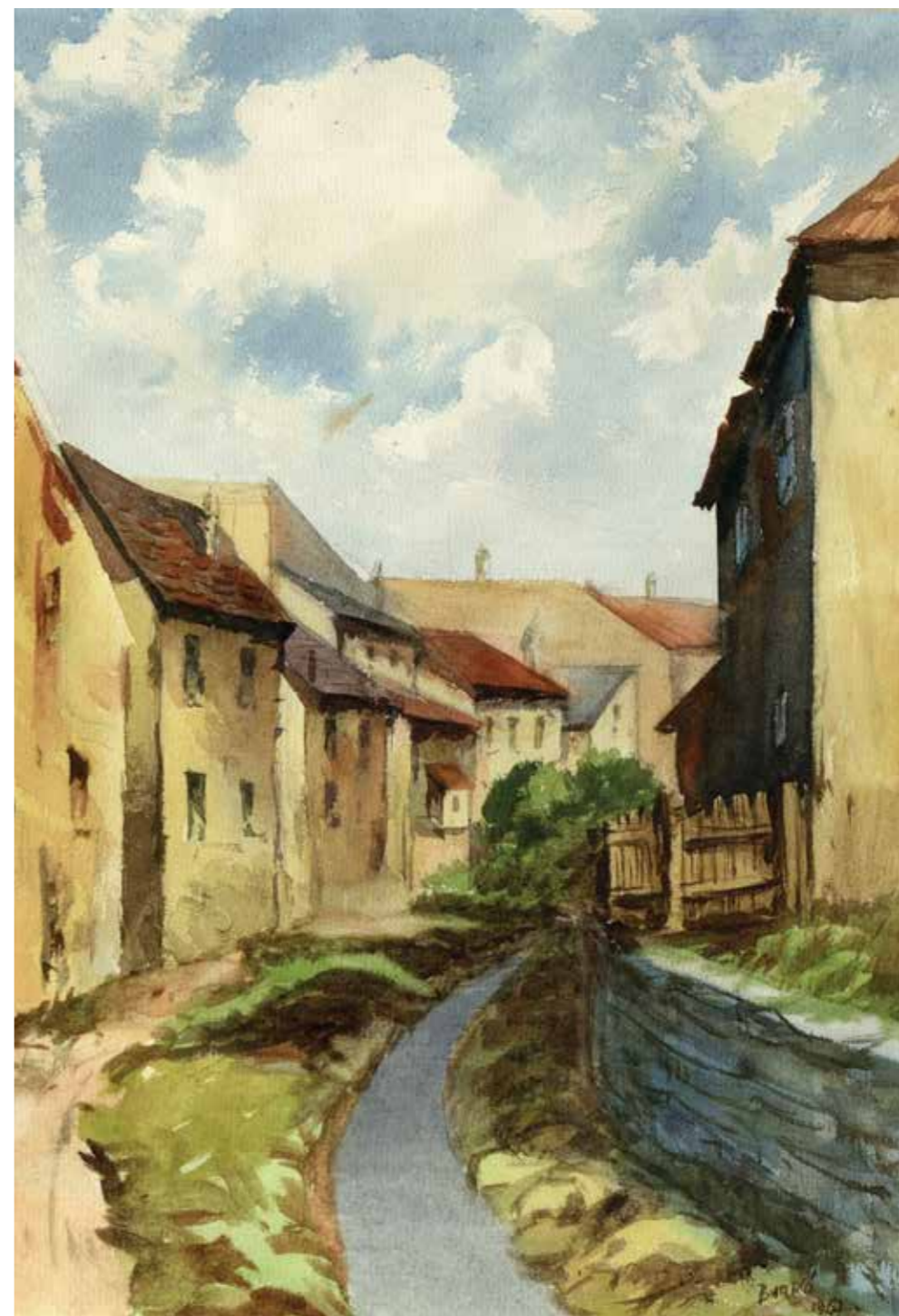
SOPRON – IKVA-PATAK, AKVARELL, 27 × 36 CM