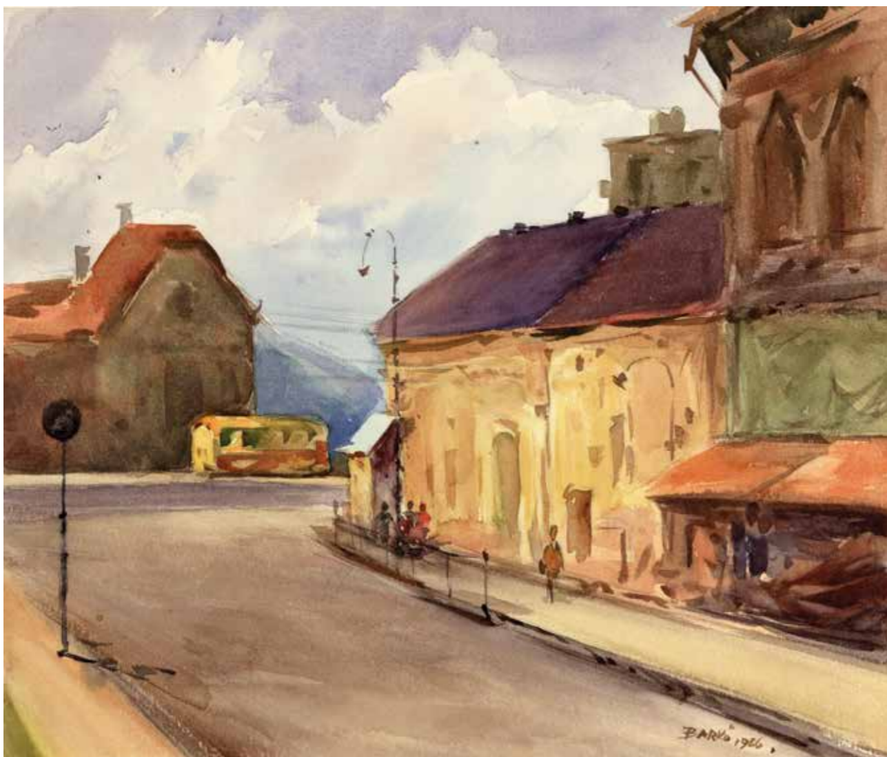
ÓBUDA – TAVASZ UTCA, AKVARELL, 32 × 27 CM