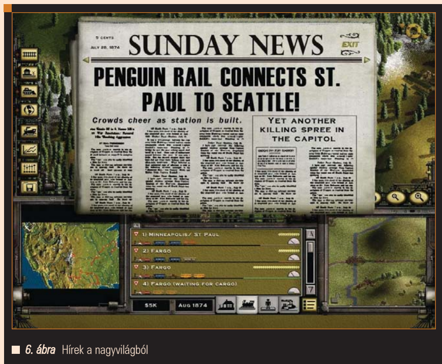
■ 6. ábra Hírek a nagyvilágból

mes újult erővel, újra és újra nekiesni a kihívásoknak. Még én is, akinek messze nem fekszik ez a stílus, cirka 25 órát töltöttem a virtuális terepen, hogy egy (középszerűnek is csak hal-kan mondható) társaságot fenn tudjak tartani... Amennyiben valaki nem tudna hozzájutni a játék teljes verziójához, úgy a linuxos demó példány elérhető a http://download.softpedia.com/linux/games/rt2-demo.run címen, minek telepítési módja megegyezik az előzőekben