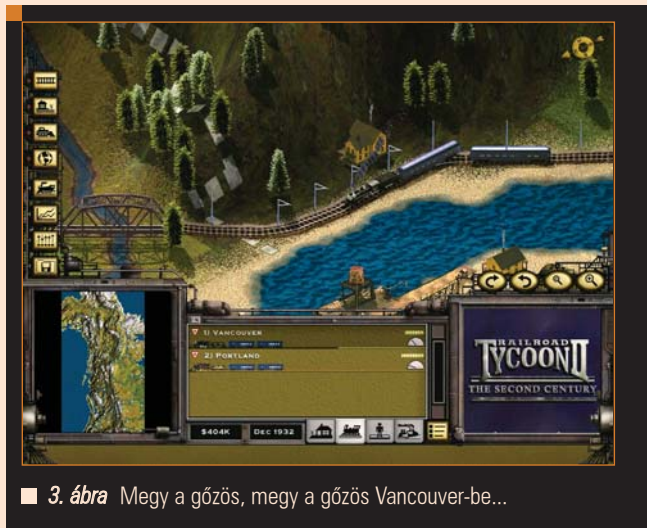
■ 3. ábra Megy a gőzös, megy a gőzös Vancouver-be...

bármilyen 3D grafikai egységet kívánna (szerencsére a műfaj jellege nem is tesz szükségessé csillogó-villogó csúcsgrafikát). A teljes telepítés helyigénye 400MByte, ami szintén átlag alatti. Röviden, tömören: érdekes és ötletes játékprogram, mely bármilyen gyenge gépen kiválóan fut.