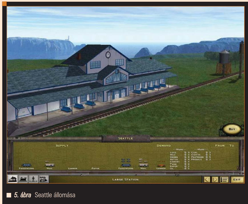
■ 5. ábra Seattle állomása

A Railroad Tycoon második része igazi, hamisítatlan megszállottságot feltételez: ha valaki rajong a stílusért, úgy akár hosszú hetekre a számítógépe elé lesz szegezve. Ha egy idő múlva esetleg unalmas lenne a játék, akkor a többjátékos szál és a pályaszerkesztő által érde-