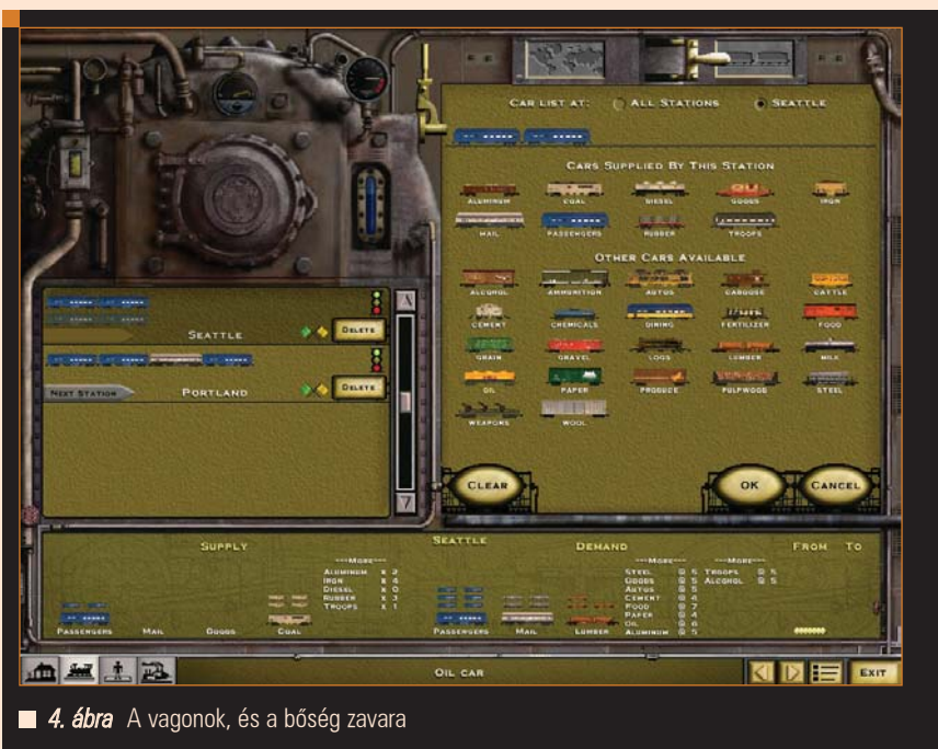
■ 4. ábra A vagonok, és a bőség zavara

átirat alapvetően hemzseg a hibáktól. A Loki utolsó foltja v1.54c jelzéssel vonult a történelembe: a hivatalos oldalon ez már sajnos nem érhető el, így a néhai legenda FTP tükrét kell használnunk: az ftp://sunsite.dk/mirrors/lokigames/patches/rt2/ URL mögött keressünk rt2_1.54c_(architektúra).run nevű fájlt! Ezt letöltve, majd root jogokkal lefuttatva, a projekt linuxos motorja a kívánt verzióra vált (ami gyakorlatilag már hibamentes). A Railroad Tycoon 2 ezek után felhasználóként, terminálra gépelt rt2 paranccsal indítható. A program a beállításainkat, mentett játékállásainkat kulturált módon, személyes mappánkban tárolja (/home/$/.loki/RT2).