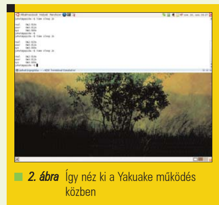
2. ábra Így néz ki a Yakuake működés közben

Alig van pár beállítás amiről tudnunk érdemes. Az egyetlen érdekesség, hogy a beállításokat a program panel-