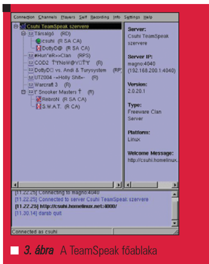
3. ábra A TeamSpeak főablaka