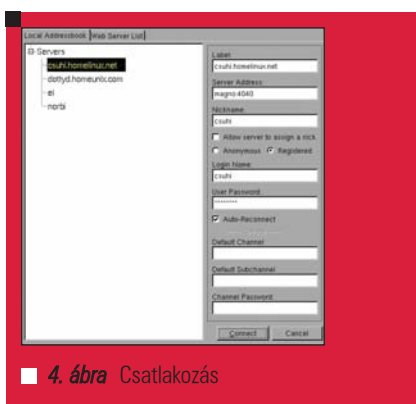
4. ábra Csatlakozás