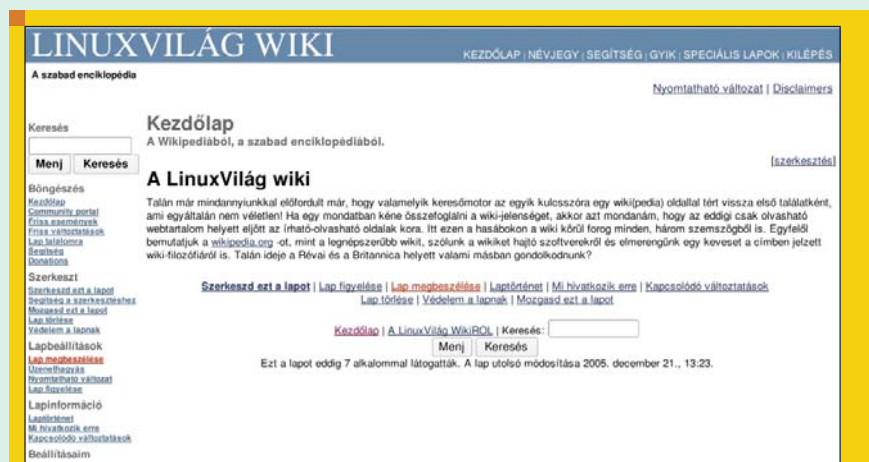
■ 3. ábra Egy telepített, testreszabott mediawiki

A Wikipedia rövid idő alatt nagy ismertségre tett szert. Ez elsősorban annak köszönhető, hogy egy ilyen vállalkozás láttán sok emberben felöltik egy hatalmas, közös, könnyen kezelhető tudás utópiája, mely nagyon vonzó alternatíva a Gutenberg-galaxishoz képest. Az angol kiadásnak jelenleg több mint háromszor annyi szócikke van, mint a nagy hírű magyar Révai Nagy Lexikonnak (896 ezer a 230 ezerrel szemben), így aztán kellő tekintélyt vívott ki magának ez a botcsinálta lexikonírók által összehordott ismerethalmaz. Talán az is a népszerűség jele, hogy már egy a wikipedia jelenséget ellenző weboldal is született: http://wikipediaclassaction.org/ . Nyilván felmerül a kérdés, hogy mennyire hiteles a majd egymillió szócikk tartalma? A közelmúltban a magyar weben is megjelent több cikk amelyek ezt a kérdést feszegették?