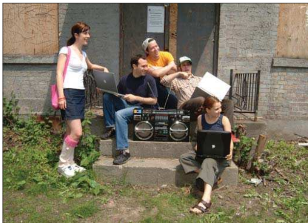
4. kép A Bass-Station