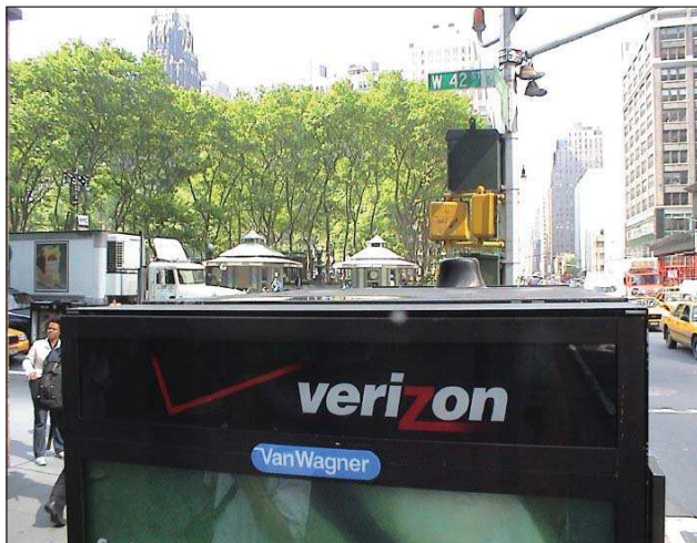
6. kép A fekete dudor ezen a nyilvános telefonon egy Wi-Fi-antenna

kivették ennek a régi darabnak a rádiós és a kazettás részét, és különféle korszerű hordozható Wi-Fi-alkatrészeket raktak bele: egy mini-ITX alaplapot, vezeték nélküli kártyát, amit egy antennához csatlakoztattak, Debian (Woody) telepítettek egy CompactFlash memóriakártyára, és egy 120 GB-os merev-