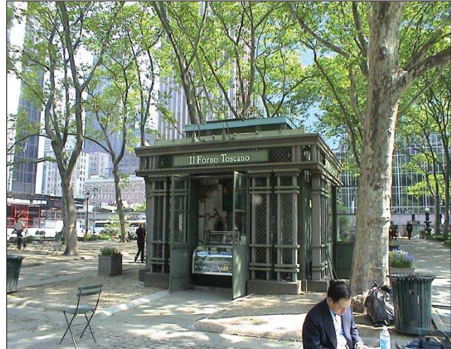
7. kép A Bryant Parkban ez a pavilon egy hozzáférési pontot tartalmaz

„Amikor új alkalmazással vagy szolgáltatással jössz elő, tényként lehet elkönyvelni, hogy a legtöbbjük csak ragasztóanyag. Ez még inkább igaz a nagyvállalatok vonatkozásában. Mivel