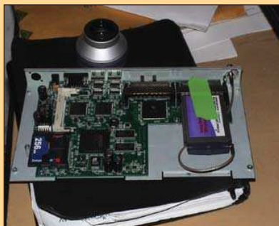
Egy költségkímélő, egykártyás (Single-Board) számítógép a Soekris Engineeringtől

Ha fel akarsz állítani egy nyilvános hozzáférési pontot (AP), akkor szükséged lesz valamire, ami jól működik és jól irányítható, továbbá kisméretű és megbízható rendszer. Valamire, ami természetesen a Linux egy