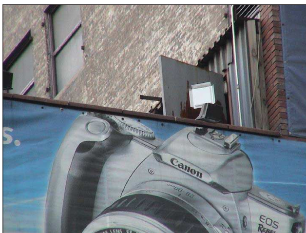
5. kép Egyetlen tetőantenna szolgálja ki a City Hall Parkot