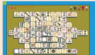
■ 1. ábra Mahjongg X alatt

Ha éppen nem a gép előtt ül, akkor fotóztat, olvasgat vagy bicajozik.