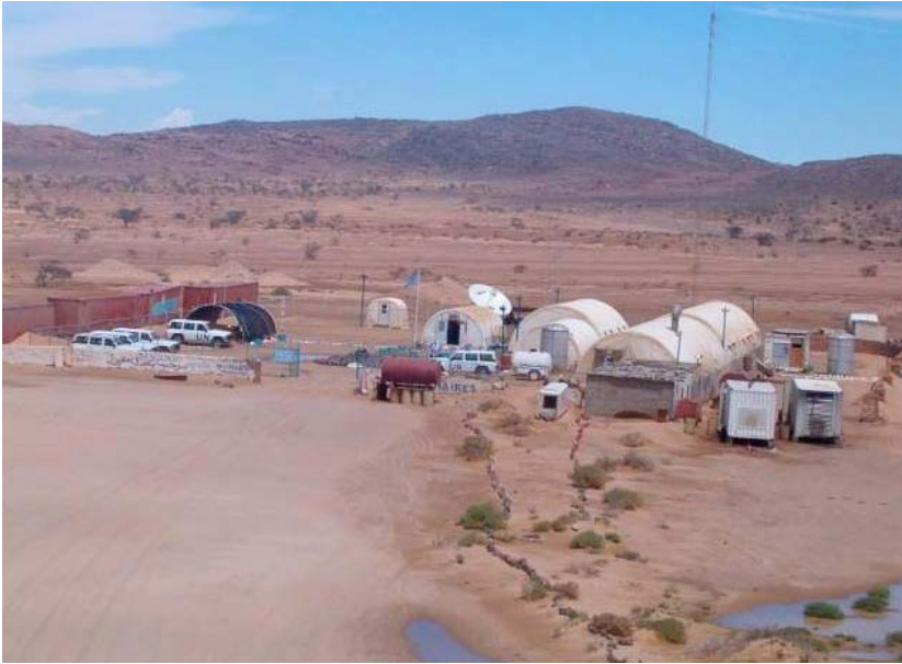
Mehaires tábor II.