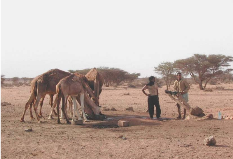
Itatás a Szaharában.