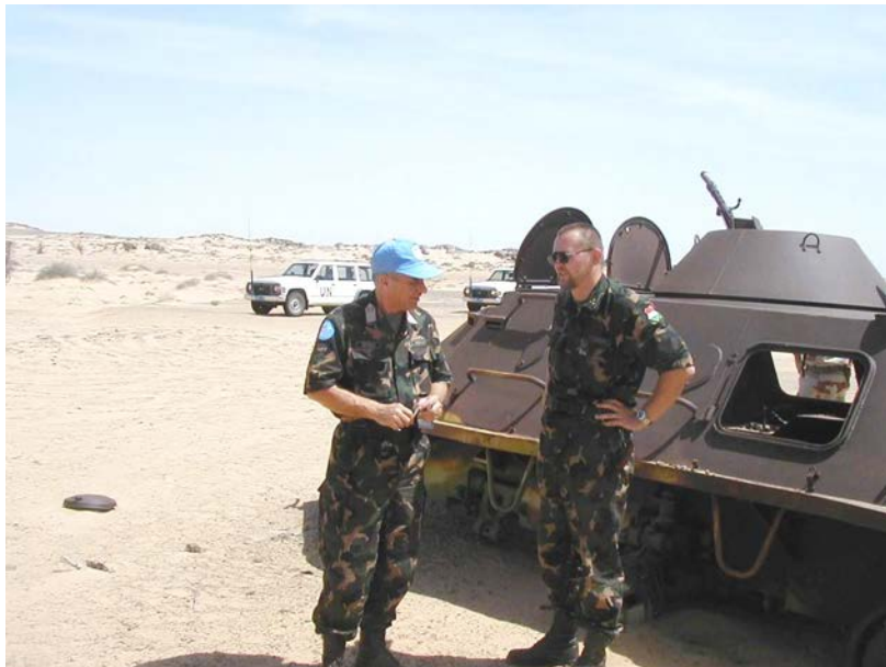
Járőrben a misszió parancsnokával Száraz György vezérőrnaggyal