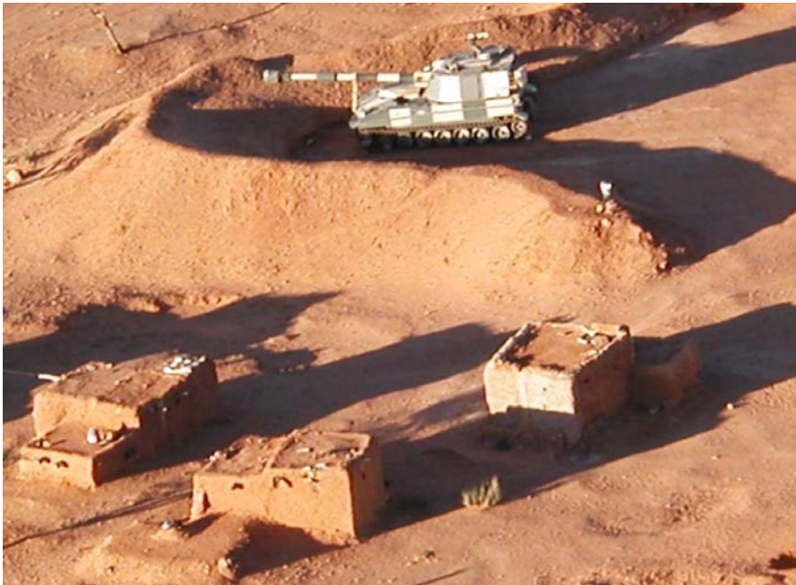
Berm- marokkói löállás