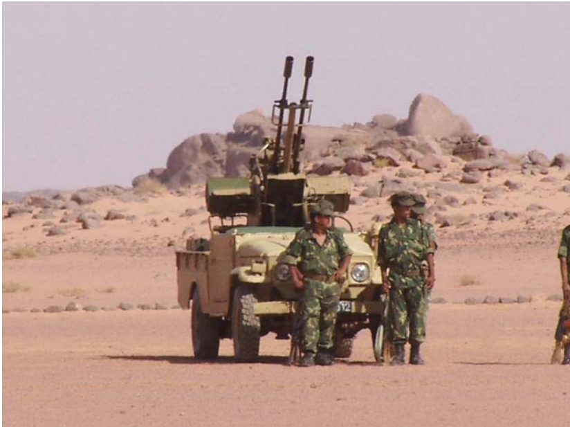
Polisario - fegyveresek