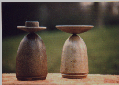
CSILLA BÉRCZY BUKOR keramik