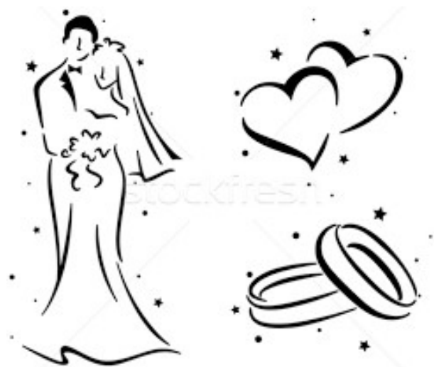
Pomáz, 2015. 11. 11.

Tehát a házasság olyan sokszínű tud lenni, amennyi szint be tudunk fogadni a szívárványból, a Mennyei Atyánkból.