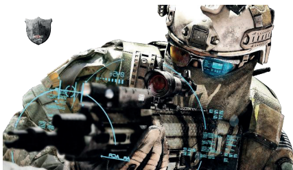
1. ábra: Első és negyedik generációs hadviselés