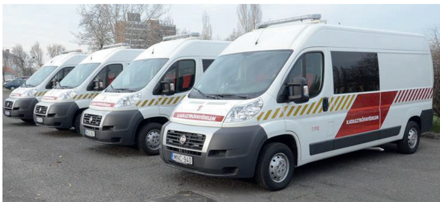
1. ábra: A KSE-gépjármű