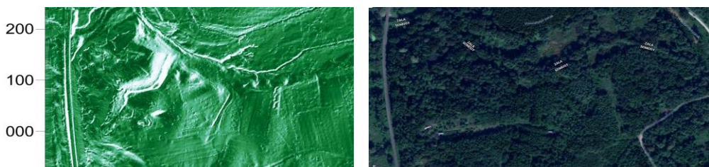
1. ábra: Légi LIDAR-ral készített felmérés eredménye (balra), és ugyanazon terület képe műholdas felvétel alapján (jobbra, forrás: Google Earth)

A Geoinformációs rendszerekkel, a 3D technológiákkal és a robotikával egyaránt szorosan összekapcsolódnak a különböző távérzékelési, távmérési és szenzortechnológiák, melynek oktatása, a mérési és feldolgozási eljárások ismertetése, illetve gyakorlatban történő bemutatása hasznos lehet a jövő üzemeltető (mérnök) tisztjei számára. Ennek keretében betekintést nyerhetnek a különböző 3D képalkotási eljárásokba (fotogrammetria, strukturált- vagy lézerefénnyel történő szkennelés), a terepfelszín pontos modelljének előállítására használható LIDAR 75 -os megoldásokba (1. ábra), vagy a különböző geofizikai mérések (magnetométeres-, talajradaros-, talajellenállás mérések) módszertanába és alkalmazási lehetőségeibe.