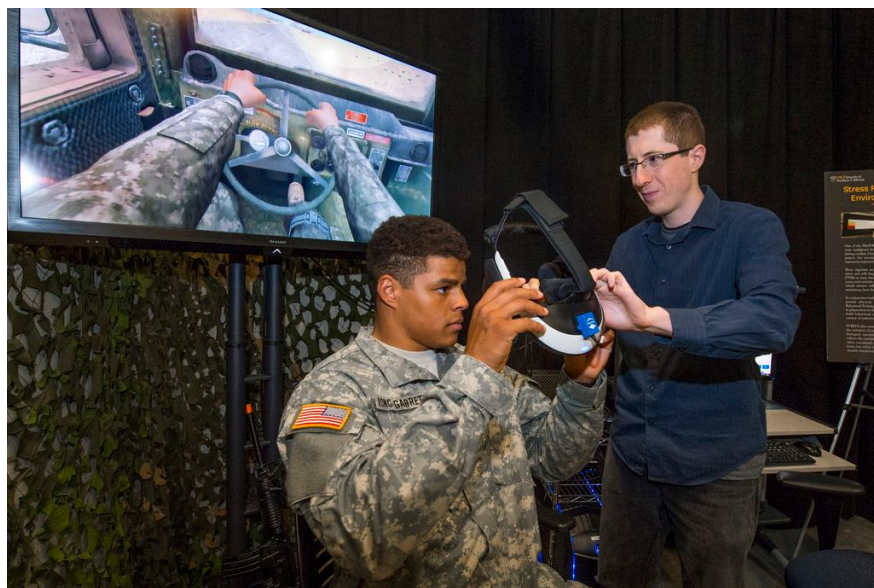
3. ábra: Példa a katonai kiképzésben használható VR megoldásokra 84