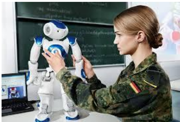
4. ábra: Példa a katonai felsőoktatásban használható robotra 91

A drónok tekintetében a francia Parrot cég Ar.drone családjá, 88 illetve a DJI 89 termékei kínálnak számos fejlesztési lehetőséget professzionális hordozóplatformokon, míg a humanoid jellegű robotok terén a Softbank Robotics Nao robotja 90 jelent az oktatásba könnyen integrálható megoldást (3. ábra).