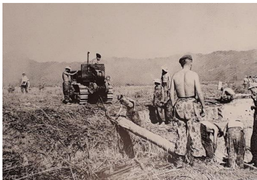
1. kép: Munkában a Caterpillar D4-es lánctalpas traktor.

A könnyű ejtőernyős utászszázad nehéz munkagépekkel sem rendelkezett így a munka nagy részét kézi eszközökkel (lapát, csákány, döngölő és szükség esetén robbanószer) végezték, de november 21-én a megfelelő minőségű fedezékek kialakításához kaptak két Caterpillar D4 típusú lánctalpas traktort. Ezek a tolólapokkal is felszerelhető, a második világháborúban már minden fronton bizonyított eszközök nagyban megkönnyítették a munkát, és lehetővé tették a nagyobb volumenű földmunkákat is. Éppen ezért, a későbbiekben még további példányok is érkeztek belőlük. Az első kettőt azonban még nagy bravúrral kellett célba juttatnia a francia légierőnek. Az egyenként 6 tonnás eszközöket a térség legnagyobb kapacitású teherszállító repülőgéppel, az amerikai segítségként érkezett, de már francia felségjelzést viselő Fairchild C–119-el, két részre szétzerelve, ejtőernyővel dobták le 21-én délután. 18 Mivel az egyik példány megsérült a földet éréskor, ezért november 4-én egy újabb Caterpillart is ledobtak. 19