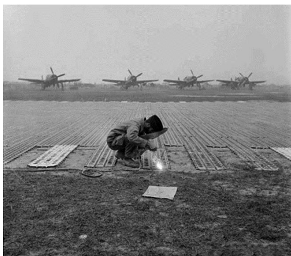
2. kép: 31 e BMG katonája PSP lapokat rögzít a repülőtéren.

Feladataik elsősorban még mindig inkább infrastrukturális jellegűek voltak és nem erődtímesek. Az egyik első feladatuk volt állandó híd és gyaloghíd létrehozása a Nam Yun folyó felett. A kórház és a főparancsnokság összekötésére a völgy keleti felében található Eliane , Dominique és Beatrice erődökkel, valamint a folyó mellett észak-dél irányba haladó 41. számú tartományi főúttal ( Route Provinciale , RP) egy fahidat emeltek a folyó felett.