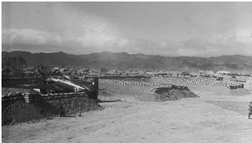
3. kép: F8F Bearcat az állóhelyén kialakított fedezékben.

Egyik legfontosabb feladatuk, az erődnek életet adó repülőter további kiépítése volt. Egyrészt a felszállópályát fel kellett készíteniük a monszunra, és le kellett burkolniuk a felületét. Ehhez összesen 22800 darab PSP ( Perforated Steel Plate , azaz perforált acéllemez) lapot használtak fel. Ezzel esőben és sárban is használhatóvá tették a repülőteret, akár a nagy C–119-es gépek számára is. Szintén a reptérrel kapcsolatos feladat volt a gépek álló és rakodóhelyeinek a kialakítása, beleértve az 1953. december 9-én először Bach Mai repülőteréről áttelepült, a GC I/22 Saintonge vadászpilóta századhoz tartozó Grumman F–8F Bearcat vadászbombázók fedezékeinek a kialakítását is. 22 A gépek egészen március 14-ig állomásoztak ideiglenesen Dien Bien Phu-ban, és a fedezékeiket a műszaki csapatok a repülőter déli részén alakították ki. Ahhoz, hogy a gépek a felszállópályára guruláskor a Nam Yun folyóba torkolló Hong Lu patak felett is át tudjanak gurulni, a szakemberek építettek egy hidat.