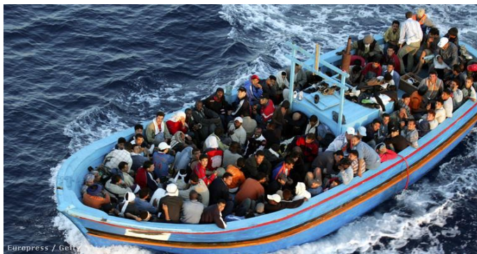
1. számú fénykép: Menekülteket szállító hajó. 13

Míg a közép- és közel-keleti térségből elsősorban Görögország irányába, addig az afrikai országokból jellemzően Olaszország, illetve a két spanyol enklávé (Ceuta, Melilla) irányába veszik útjukat az illegális migránsok.