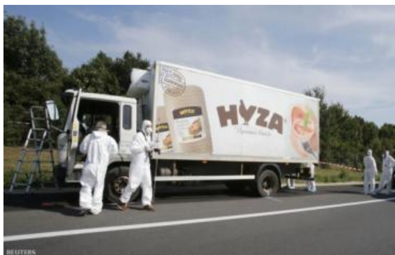
2. számú fénykép: A 71 elhunyt menekültet szállító teherautó. 21

Arra vonatkozóan is nyilatkoztatni szükséges őket, hogy sérelmükre az embercsempészek követtek-e el bűncselekményt. A feltartóztatott illegális bevándorlótól nagyon sok olyan esetről hallani, amikor azután, hogy kifizetik az Európába tartó illegális utazásért kért pénz egy részét vagy egészét, az embercsempészek fenyegetik, meglopják, kirabolják őket, nem addig utaztatják őket, ameddig megígérték, vagy egyszerűen a pénz átadását követően nem viszik sehova.