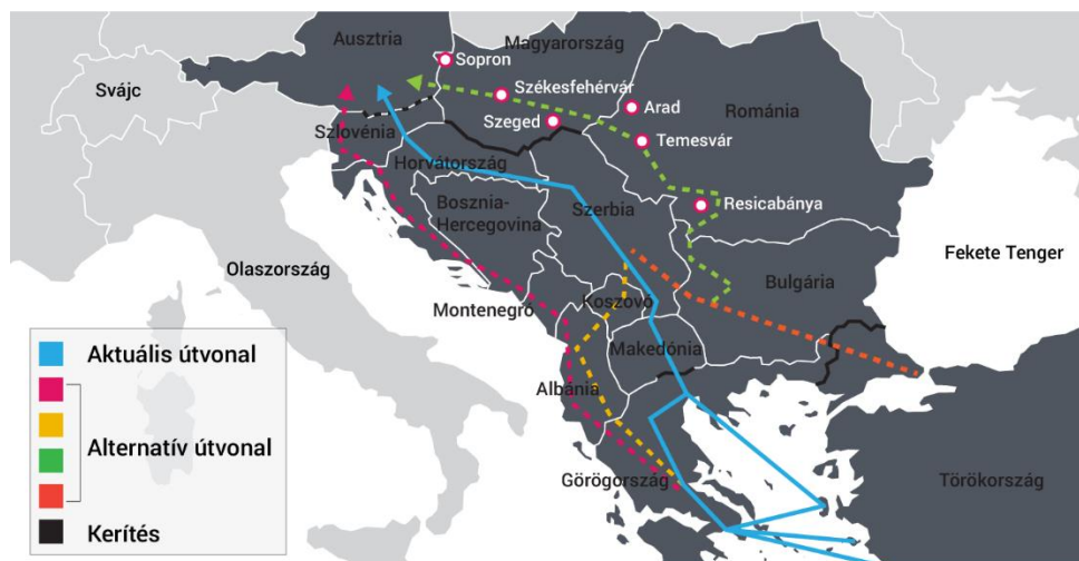
1. számú ábra: Új migráns útvonalak Európában. 14

irányai a következők: Törökország – Görögország – Macedónia – Szerbia – Magyarország, a másik fő irány Törökország – Bulgária – Szerbia – Magyarország, valamint említést érdemel a Törökország – Bulgária – Románia – Magyarország útvonal is.