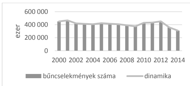
1. ábra: Az ismertté vált bűncselekmények száma és dinamikája Magyarországon (2000-2014) (2000 = 100%)

Adatbázis: az ERÜBS és az ORFK Elemző-Értékelő Főosztály adatai alapján saját szerkesztés